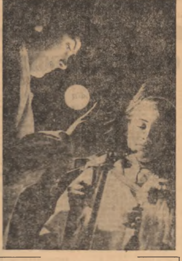
IN LUMEA MOLECULELOR. Oră de laborator la Liceul agricol din Calafat.

Ca răspuns la acest turneu, Teatrul de Operă din București va pleca în capitala țării vecine la începutul lunii mai.