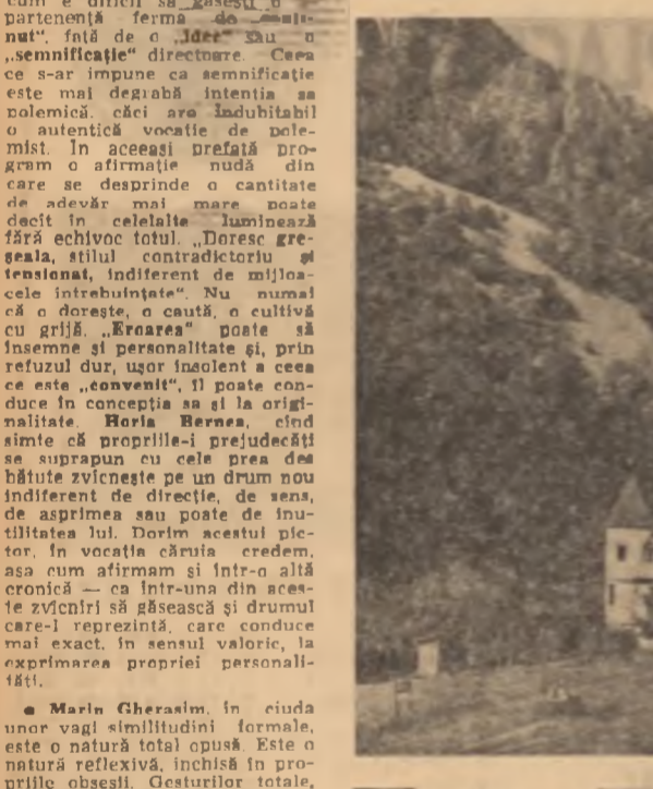
„Cheile Turzii” că intră la drumetie