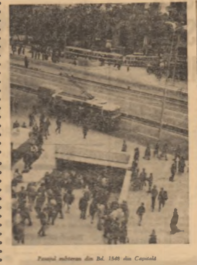
Timpul tinerilor din Bd. 1569 din Capitală