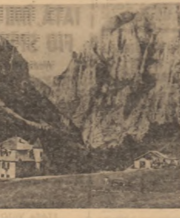
„Cheile Turzii” că intră la drumetie