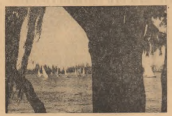
Zile de primăvară în parcul Herăstrău din Capitală

Pe Drumul național 10 Buzău-Brasov elevii ai școlii profesionale Ojasea și ai școlilor generale din Vernești, Cislău, Măgura etc. au pregătit gropile pentru plantarea a 1.800 pomi ornamentali. Mobilizații de organizații U.T.C. tinerii au plantat plopi canadieni în comune și între comune. Pînă la 13 aprilie jumătate din angajamentul anual a fost realizat. Acțiunea de împădurire continuă.