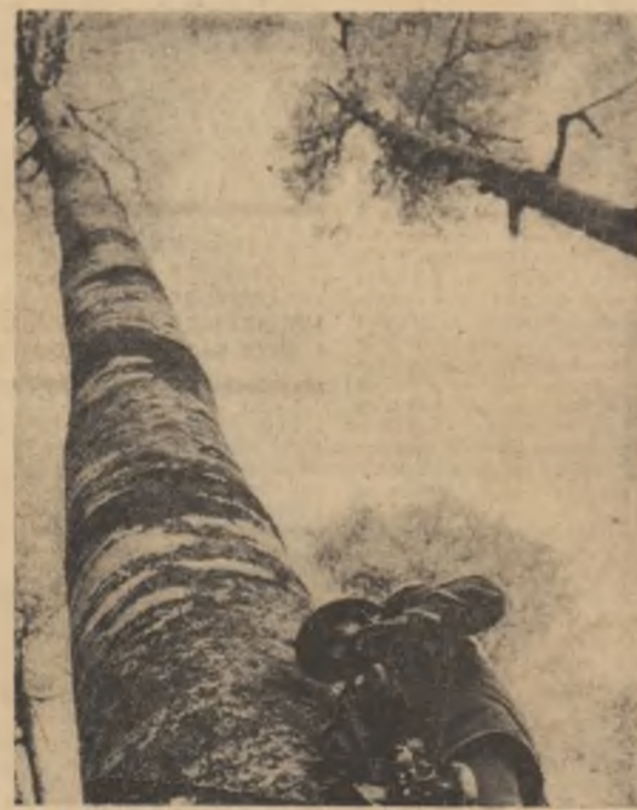
Tăietori de lemna din întreprinderea forestieră Gorj