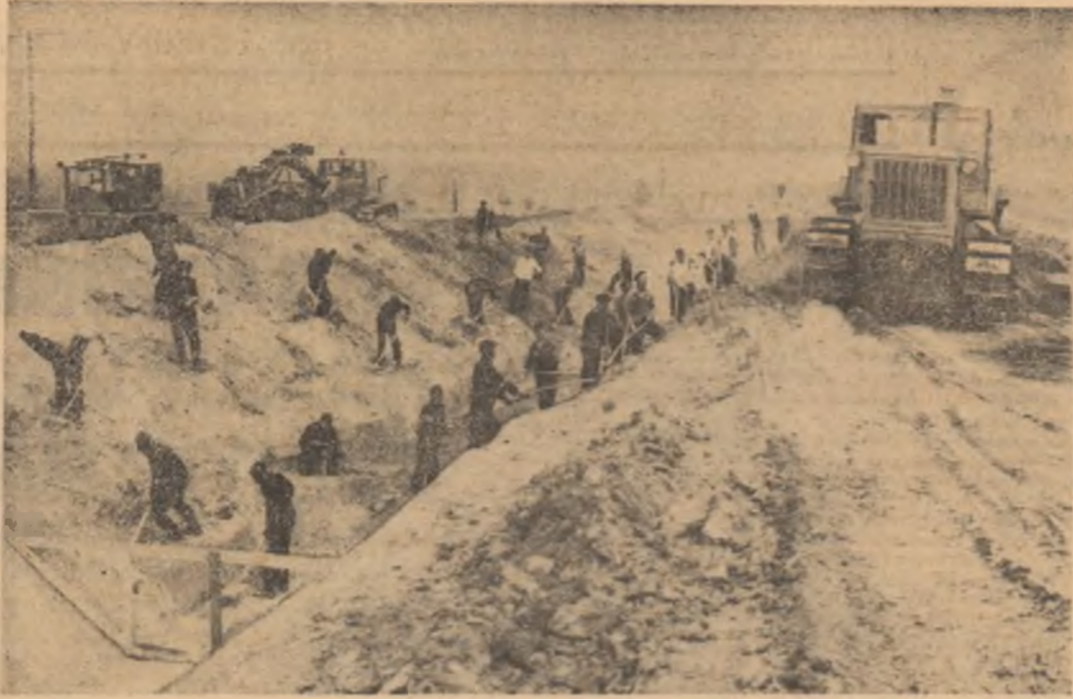
Pînă departe, în zona cîmpiei, un drum pentru ape...