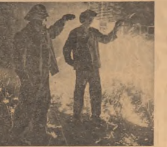
© nouă apariție la jurnalul numărul 1 — Reșița

de drum ale unor scene bucureștene) nu face decât să sublinieze această realitate. Pe urmele acestei realități, ancheta noastră — care s-a adresat cititorilor reprezentanți ai dramaturgiei tinere, ai scenei și ai criticilor teatrale — și-a propus să-și desceartze cauzele și să sugereze remedii. În mod firesc, discuția a pornit de la încercarea de a formula o caracterizare definitorie pentru scrierul dramatic al tinerilor, subliniindu-și călățiile, dar neoculind nici primediile relevate la timpul cuvenit de către critică: o anume uniformitate a inspirației, au-