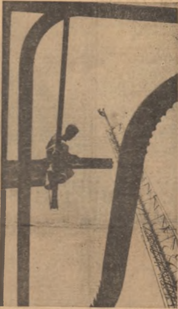
(Continuare în pag. a III-a)

Profiluri contemporane la Craiova. Secvență de lucru pe platforma nr. 2 a Combinatului chimic