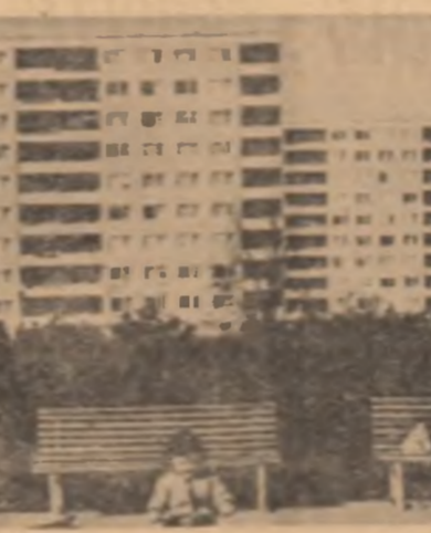
AUSTRIA. — Locuitorii noi în 10 km de Viena

La universitatea Lovrenca din Wisconsin s-a încheiat greva foamei de 48 de ore, declarată de un grup de studenți în semn de protest împotriva continuării războiului din Vietnam.