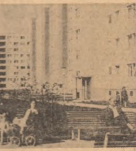
AUSTRIA. — Locuitorii noi în 10 km de Viena

glas de Salinas. Militarii au trecut la sfidarea Salinas a fost numit „vînzător de pregedinte”. Cîrești revomari că Ovando Candia ar fi tentat să ia în mîna puterea prin forța armelor. N-ar trebui exclusiv această posibilitate, mai ales dacă este vorba de vizite-falger ale ofițerilor armatei la diferite garnizoane militare. Potrivit cotidianului francez COMBAT în cadrul unei dintr-o asemenea vizite Candia a declarat: