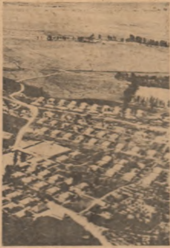
I. R. R. C. S. — Au sosit în Anglia pentru a participa la sesiunea de lucru a Comitetului Central al P.C.R. și Comitetului Central al P.C.U. în cadrul reuniunii interpartiduale la Londra.

LONDRA 14. — Corespondentul Agerpres, I. R. R. C. S., transmite: Delegația I. R. R. C. S. a sosit în Anglia pentru a participa la sesiunea de lucru a Comitetului Central al P.C.R. și Comitetului Central al P.C.U. în cadrul reuniunii interpartiduale la Londra.