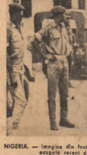
NIGERIA. — Imagine din festa capitalei biofizică Umuhia, ocupată recent de trupele federale