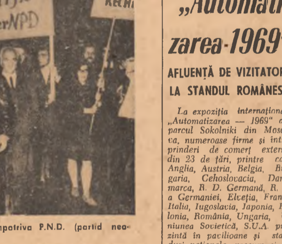
R. F. A GERMANIEI. — Aspect din timpul unei demonstrații împotriva P.N.D. (partid nazist) în orașul Penzberg