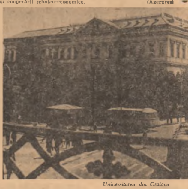
Universitatea din Craiova