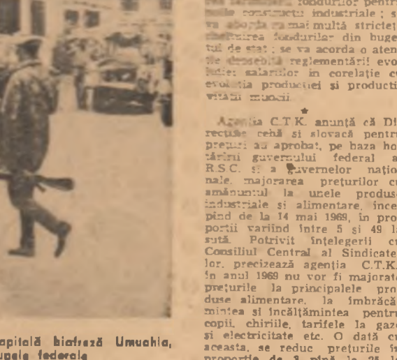
NIGERIA. — Imagine din festa capitalei biofizică Umuhia, ocupată recent de trupele federale