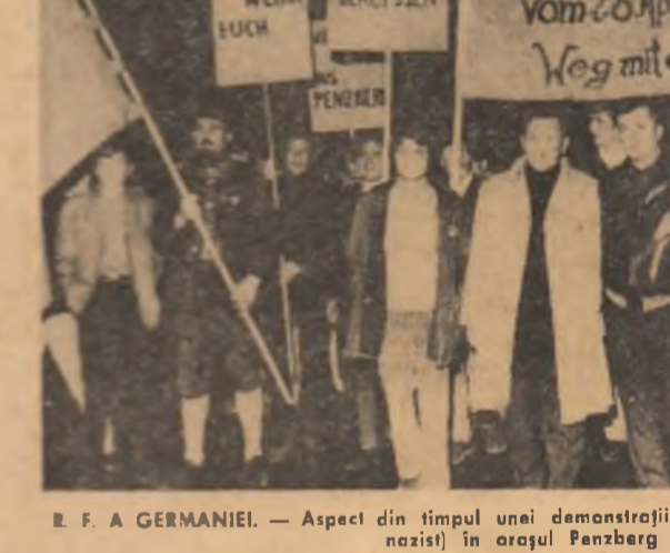
R. F. A GERMANIEI. — Aspect din timpul unei demonstrații împotriva P.N.D. (partid nazist) în orașul Penzberg

● RĂZBOIUL Împotriva impunerii unei noi orientări politice Partidului Socialist