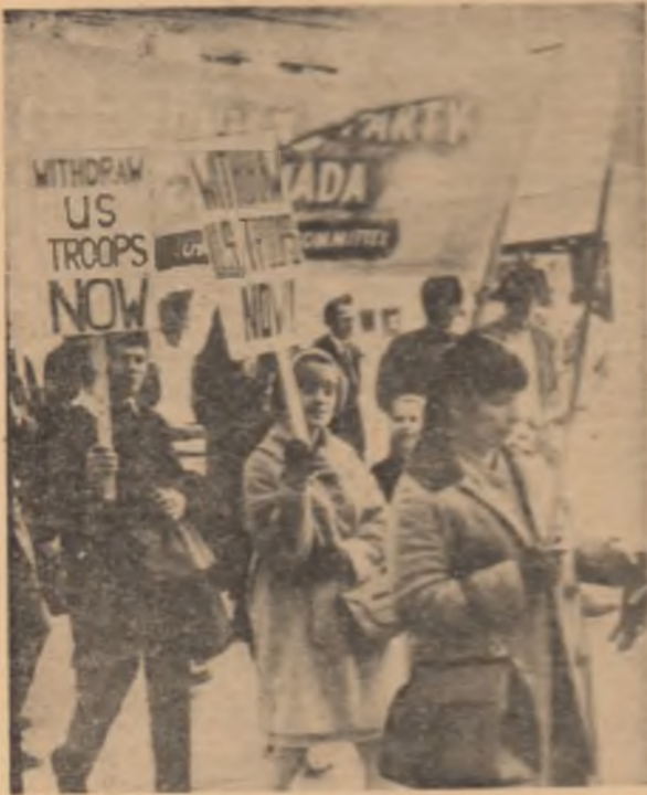
CANADA. Demonstrația la Toronto împotriva agresiunii americane în Vietnam

Incidente violente între grupuri de diverse naționalități au izbucnit miercuri noaptea la Kuala Lumpur, capitala Malayi, după o scurtă perioadă de calm în cursul căreia poliția a anunțat ridicarea stării de urgență pentru două ore. Primele incidente au avut loc la Petaling Jaya, un cartier industrial al orașului Kuala Lumpur, unde s-au desfășurat adevărate lupte de stradă. Armata a deschis focul asupra multor. Potrivit primelor informații, în cursul acestui incident au fost ucise trei persoane. Forțele de ordine au încredințat cartierul, operind numeroase arestări. În oraș, spitalele sînt arbilune, medicii și personalul sanitar neputînd face față numărului mare de răniți. Situația este deosebit de gravă și datorită lipsei de alimente, precum și a creșterii vertiginoase a prețurilor. Primul ministru Abdul Rahman a decretat joi starea de urgență pe întreg teritoriul Malayi. El a anunțat totodată crearea unui Consiliu Național pentru coordonarea activității administrației civile, poliției și armatei, ca urmare a tulburărilor grave ce a cuprins populația, opunînd în confruntări sîngeroase diferite grupuri etnice. Noul consiliu va fi condus de Abdul Razak, vicepremier și ministru al apărării.