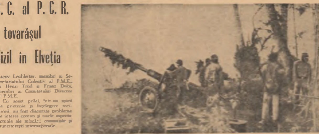
O subunitate a poliției laezării în timpul unei misiuni de luptă

Expoziția va fi deschisă la Minsk o lună după care va fi prezentată în două centre regionale bielorusse, Gomel și Vitebsk.