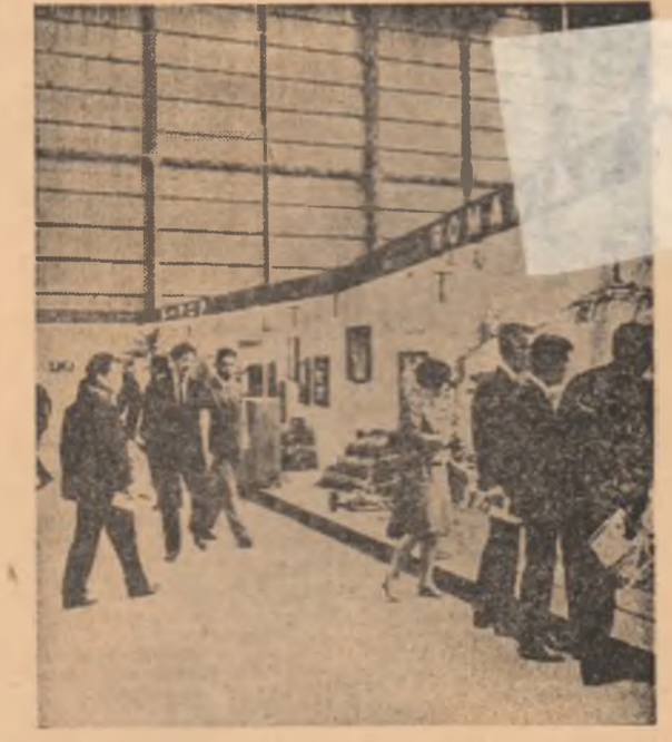
Pavilionul României la recentul Tîrg internațional de la Tokio