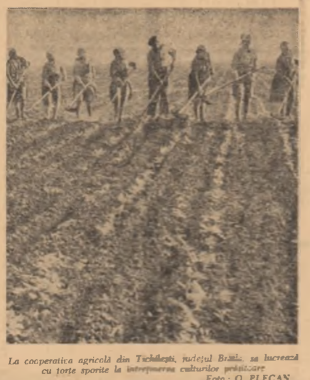
La cooperativa agricolă din Tichilești, județul Brăila, se lucrează cu forțe sporite la întreprinderea culturilor pîșitoare.

mentul. Acum am amecioas, dar fiecare kilometru cîștigat îl sărbătorim. Aceasta se întimplă o dată la o săptămînă, sau la două săptămîni. Dar știm că vom cîștiga! În 1967 s-a semănat pentru prima dată pe terenurile scoase de noi de sub apă. Pînă atunci se cultivaseră grîndurile. A fost cea mai mare lucrare pe care am trăit-o în anii de cînd practic meseria. Ba nu, acum parcă e înclină să spun că bucuria cea mai deosebită am trăit-o în martie, anul acesta, cînd prin lucrările executate m-am convins și pe teren, că 1969 ca și anul cînd pentru prima dată se poate spune că Insula Mare a Brăilei este o INSULĂ, că în întregime ea putea fi cultivată. Aprape concomitent au intrat, apoi, pe cel mai nou pămînt al țării, specialiștii agronomi și semăntorii. Au cercetat și au cultivat suprafețe mereu mai mari: au cercetat, au cultivat și au sperat. Iar azi — și de acum încolo mereu — și pe acele terenuri, situate pe alocuri la mulți metri sub nivelul Dunării, să se strîngă recolte. In decur primăverii depline, GH. FECIORU (Continuare în pag. a III-a)