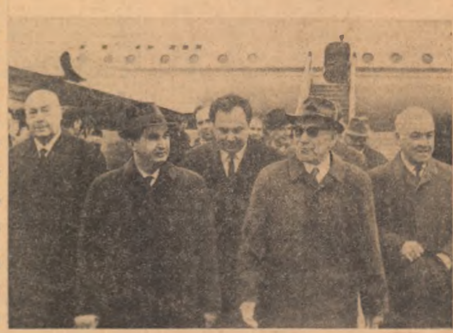
Pe aeroportul Okęcie din Varșovia