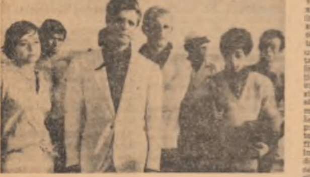
Secență din film