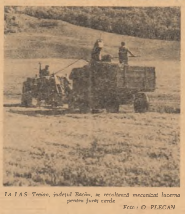
La I.A.S. Troniu, județul Bacău, se recoltează mecanizat lucerna pentru furaj cerde.

— Personalitatea este un continuu în permanență schimbare. Ca și cultura. Ca și civilizațiile, care au propriile lor procese de dezvoltare. Dar cum evoluează culturile, civilizațiile, în raport cu schimbările din cadrul personalității? E. P.: Printr-o viață și continuu interacțiune. Fără să existe numai o personalitate individuală, ci și una colectivă, adică personalitatea unei culturi sau a unei civilizații. Reciprociitatea dintre personalitatea culturii și personalitatea indivizilor reprezentativi dinăuntrul ei este organică și totală. Cultura e creată de oameni în aceeași măsură în care și ea creează oameni. — Există încă invenții fără inventator? Sau operă fără autor? E. P.: Nu. Dar nu există