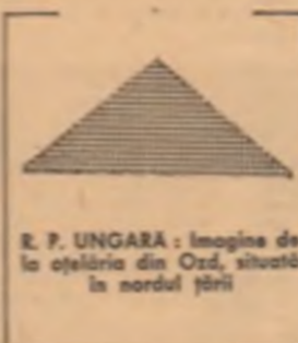
E. F. UNGARA: imagine de la oclăria din Ozd, situată în nordul țării.

Dezacordurile existente în cadrul lucrărilor politice din cadrul sesiunii următoare, a fost respinsă și pentru că s-a considerat că este necesară o sesiune de lucru pentru a se discuta problema dezarmării generale.