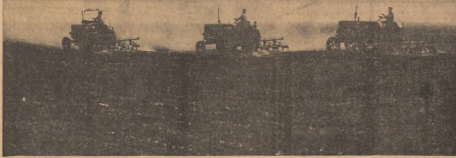
La întreținerea culturilor, aportul mecanizatorilor este solicitat din plin. Obiectivul fotografic a surprins un grup de mecanizatori ce deservesc cooperativa agricolă din Valea Cinepei, județul Brăila, la culticarea porumbului