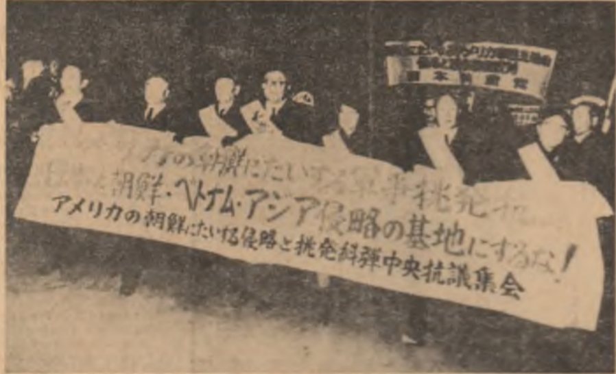
JAPONIA. Aspect de la o recentă manifestație împotriva prezenței militare americane.