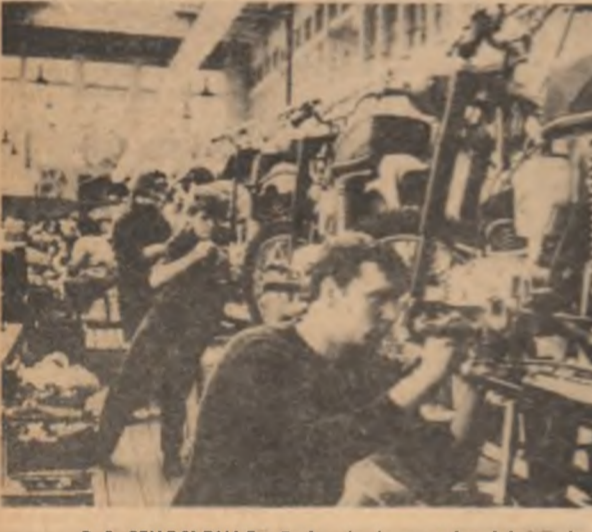
R. S. CEHOSLOVACA. Pe banda de montaj a fabricii de motocicleti din Strakonice.

Răspunzînd unei întrebări referitoare la intenția de a se demita în favoarea unui alt candidat, Jacques Duclos, candidatul Partidului Comunist Francez a declarat la rîndul său că „oricare problemă privind dezistarea în cel de-al doilea tur de scrutin este prematură”. În luptă pentru a obține maximum de voturi la primul tur, iar la 2 iunie vom decide”.