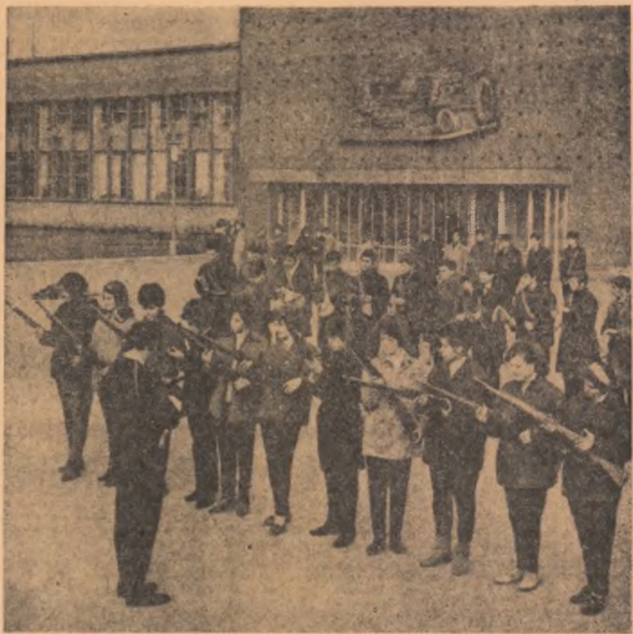
Pe platoul central al uzinelor „Tractorul”-Brașov, fetele și băieții au început orele de pregătire militară generală