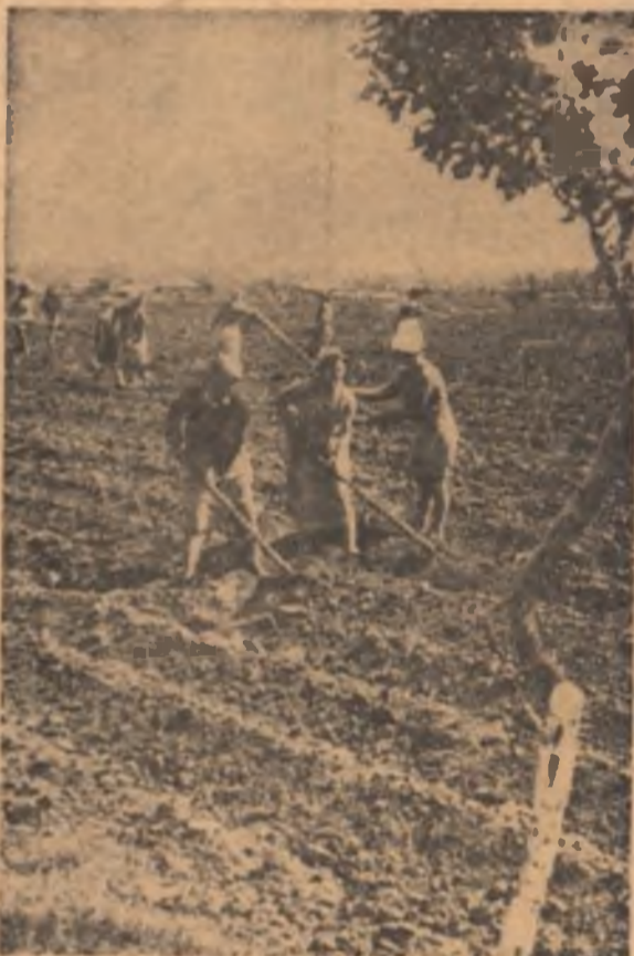
La C.A.P. Mîrcea Vodă, județul Brăila, se lucrează intens în grădina de legume