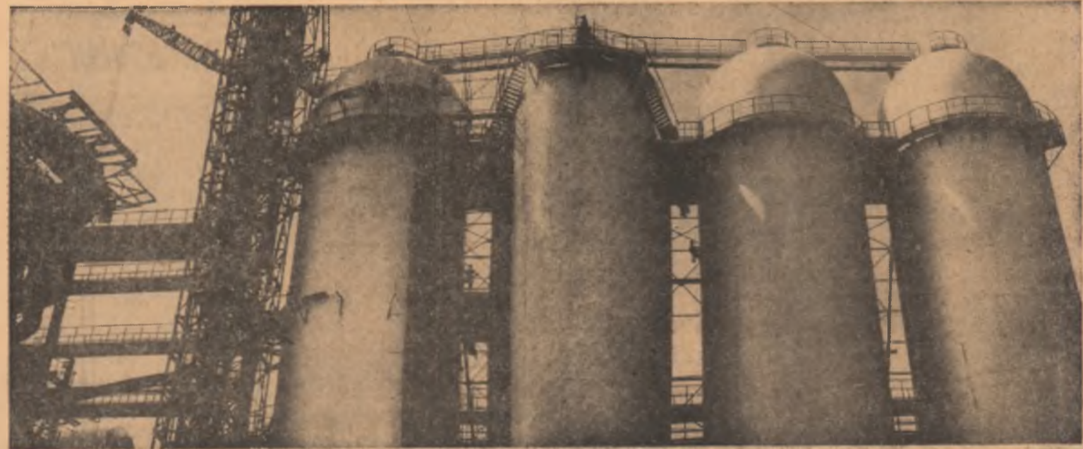
Ora de muncă pe șantierul clădirii premiere gălățene — al doilea jurnal de 1700 metri cubi