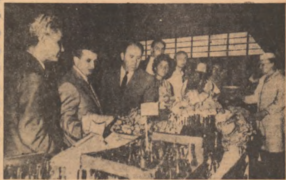
In piața Obor

Duminică dimineața, tovarășul Nicolae Ceaușescu, secretar general al Comitetului Central al Partidului Comunist Român, președintele Consiliului de Stat, însoțit de tovarășii Virgil Trafin, membru al Comitetului Executiv, al Prezidiului Permanent, secretar al C.C. al P.C.R., Dumitru Popa, membru supleant al Comitetului Executiv al C.C. al P.C.R., prim-secretar al Comitetului municipal de partid București, primarul general al Capitalei, și Ion Pășan, vicepreședinte al Consiliului de Miniștri, au făcut o vizită prin piețele Bucureștiului. A fost o vizită de lucru, una din vizitele devenite tradiționale în ultimii ani — prin care conducătorii de partid și de stat cercetează la fața locului viața întreprinderilor și instituțiilor, activitatea diurnă a șantierei și a comerțului, consultîndu-se cu pături largi ale populației în cele mai diverse probleme.