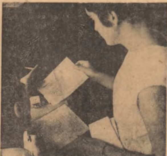
„Alia facta est”