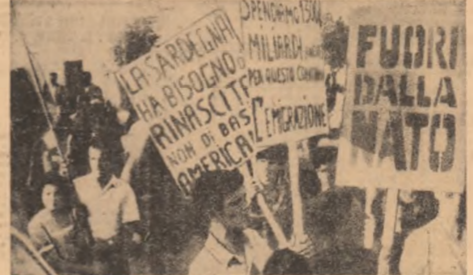
Demonstrație în localitatea Villasor din Sardinia, în favoarea ieșirii Italiei din N.A.T.O.

Opinia publică americană a fost de a se abține să îndrăgească în războiul din Vietnam și să nu mai trimită mai mulți tineri americani deei în timpul războiului din Coreea", scrie "Influential critician din S.U.A. — WASHINGTON EVENING STAR". Continutul acestor războaie, remarcă ziarul, sacrificiile Statelor Unite le vor veni pe calea din timpul celui de-al doilea război mondial.