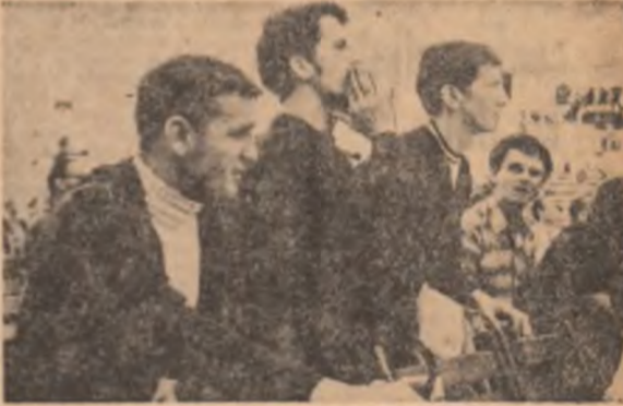
„Hai, România!”, „Hai, România!”