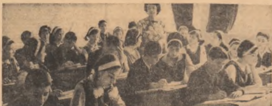
Ultimele lecții la clasa a VIII-a sînt cele de sinteză. În fotografia: o clasă a VIII-a a Liceului nr. 24 din Capitală.

Asa cum arată numeroși comentatori ai creației artistice, teoreticieni și critici, o seamă din marii artiști nu au inventat forme noi, ci le-au dezvoltat pe cele existente în vremea lor. Shakespeare a folosit formele deja existente în teatrul elizabetan, ridicînd însă pe culmi unice aceste forme. Cum a făcut-o? Imbogățind cu sentimentele și ideile sale, cu viziuni personale și cu imaginație proprie tragedia, comedia, drama. La fel, Eminescu, oricît de unic ne pare, a înglobat în geniala creație ecouri din imaginația poporului, suflul versului popular și, totodată, învățămintele romantismului, ajungînd, într-adevăr, la o sinteză deosebită proprie lui cit și reprezentativă pentru cultura neamului. Desigur, asemenea sinteze înseamnă și inovații, constituie însă din punct de vedere confluente naționale și univer-