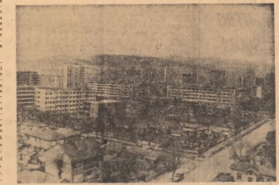
R. P. BULGARIA. Imagine din orașul Stara Zagora

Portavionul australian intrase de puțin timp în serviciu. El fusese immobilizat timp de cîteva luni, în urma unui incident asemănător survenit la 10 februarie 1964, când s-a ciocnit cu contratorpilorul „Voyager”, aparținând, de asemenea, marinei australiene.