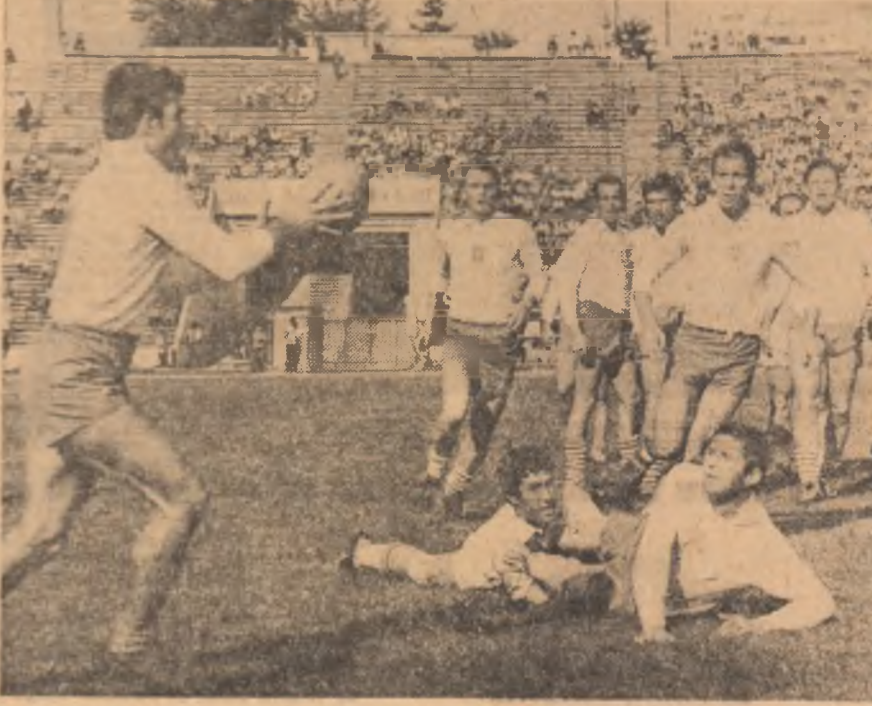
Rugbi: Fază la mijlocul terenului