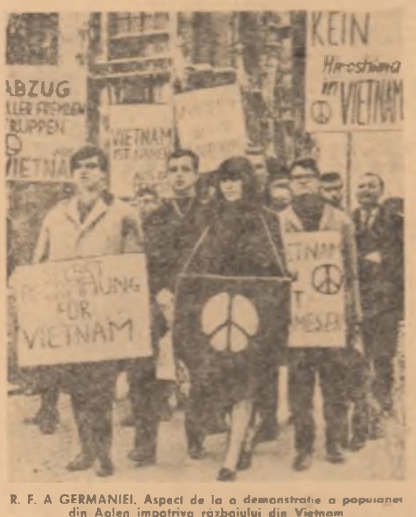
R. F. A GERMANIEI. Aspect de la o demonstrație a populației din Aalen împotriva războiului din Vietnam