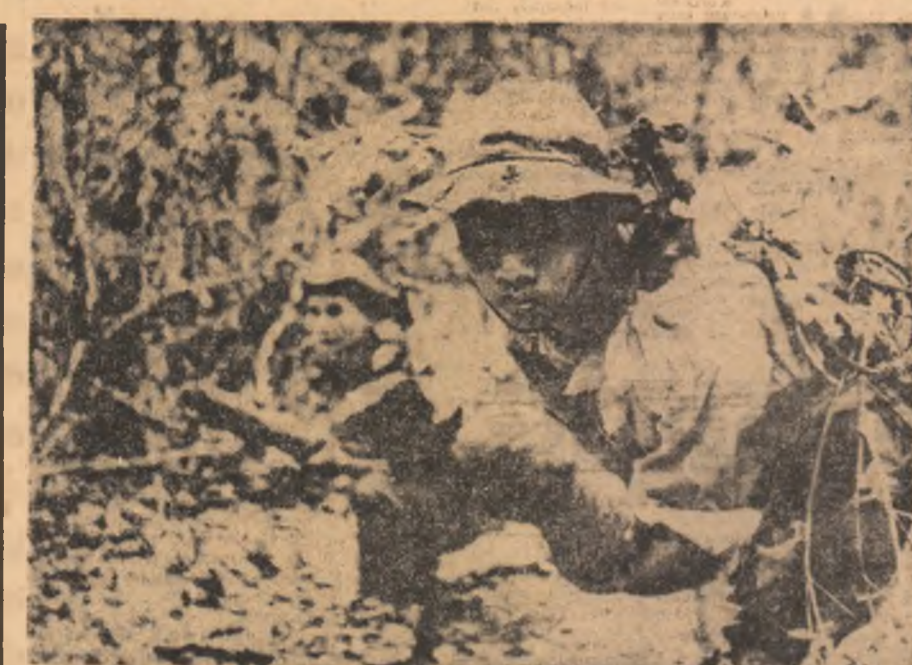
VIETNAMUL DE SUD. O subunitate de patrioți în timpul unei acțiuni în zona Platourilor Inalte