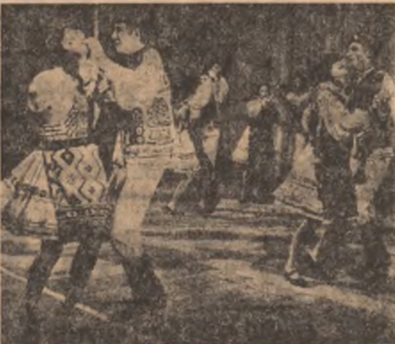
Moment din spectacol