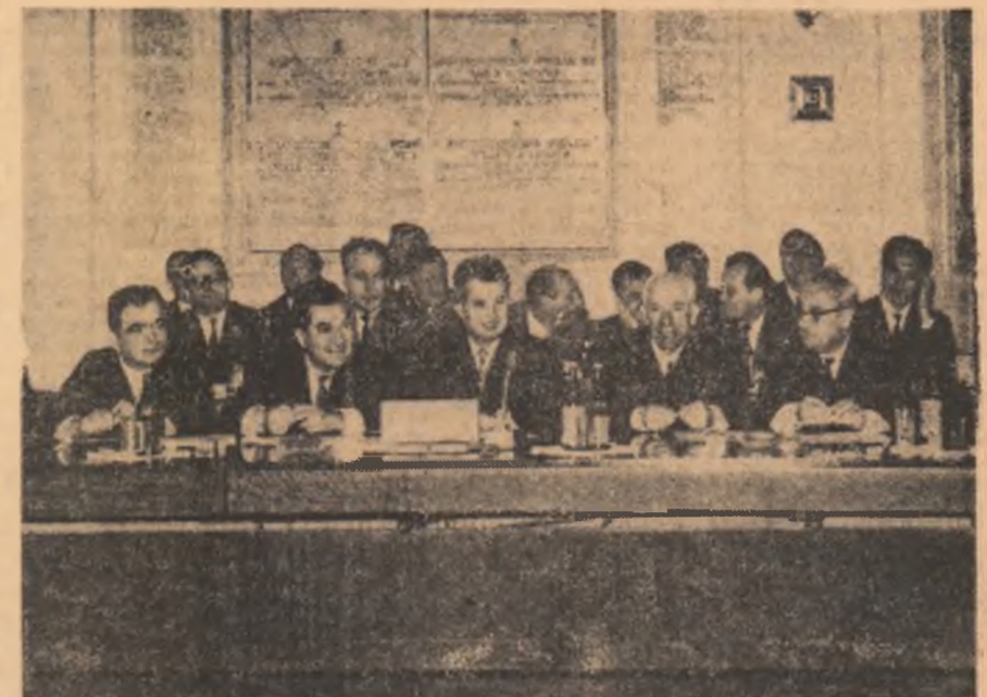
Delegația Partidului Comunist Român, condusă de tovarășul Nicolae Ceaușescu, în timpul lucrărilor Consătăririi