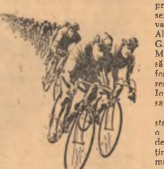
TURUL ROMÂNIEI A 18-a EDIȚIE, 15-30 Iunie 1968 ORGANIZAT DE FEDERAȚIA ROMÂNĂ DE CICLISM LOTO PRONSPORT ȘI ZIARUL SPORTUL

Un fapt inedit este și acela că startul se va da din Galați. Este o formulă nouă pe care — credem — organizatorul o vor menține pentru popularizarea ciclismului în toate colțurile țării. La capitalul notate mai vom ține și caracterul „non-stop” al acestei a 18-a ediții a „Turului României”. Pentru prima oară se consumă toate cele 12 etape fără nici o zi de odihnă. Și acum traseul: caravana ciclistă va poposi în orașele: Băcanu, Suceava, Vatra Dornei, Cluj, Oradea, Timișoara, Arad, Hîrneasa, Sibiu, Brașov, București, însumînd aproximativ 1500 km.