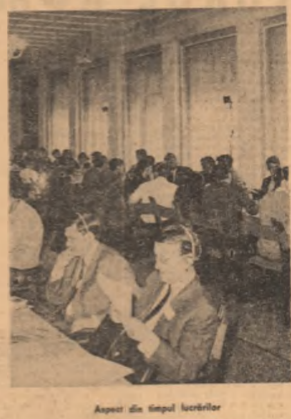
Aspect din timpul lucrărilor

au luat cuvîntul o reafirmare a unor dorințe comune: distensionarea bătărilor militare retragerea trupelor străine de pe teritoriile altor țări, asigurarea condițiilor pentru colaborarea științifică dintre state avansate și estale în drepturi. În cuvîntul lor, vorbitorii vorbitori au subliniat necesitatea întinderii experiențelor ca am să luăm în orice caz și să cerem pagii noastre pentru demararea nucleară, subliniind pericolul pe care îl reprezintă în prezent și în viitor pentru Europa, și pentru întreaga lume. Participanții la discuții au subliniat în mod repetat importanța și utilitatea reuniunilor de genul actualei „mese rotunde“, revizuită și aici pe platforma României, se afirmă un acord în spirit de colaborare reciprocă și de construire eficientă între organizațiile de tineret de toate țările din Europa. Seura delegații la „masa rotundă“ au luat parte la o sesiune de lucru. Lucrările „mesei rotunde“ Tineretul și securitatea europeană, continuă.