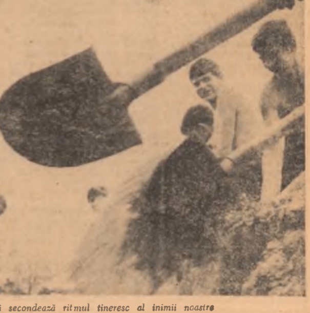
Ritmul întrecerii secondează ritmul tineresc al inimii noastre

mi-am propus să fiu aici printre primii. N-am putut veni decît decît să lucrem unul lângă celălalt pe șantierul nostru, din Timișul de Jos, dar, oricum, să știu că și așa sîntem acum egali”. Serviciul de circulație al miliției a fixat pe șosea, în această zonă, semne convenționale „Șantier în lucru” pentru limitarea vitezei autovehiculelor. În următoarele două săptămîni, pe drumul național 15, între km. 17—18 steaguri roșii și tricolore vor marca puncte distincte. Șoseaua Toplița—Borsec va purta în defileul superior al Mureșului amprenta participării tinerii generații la îmbogățirea cu noi frumuseți a peisajului patriei socialiste. (De la corespondenții noștri județeni: V. RĂVESCU, I. DAN, C. POĞACEANU.)