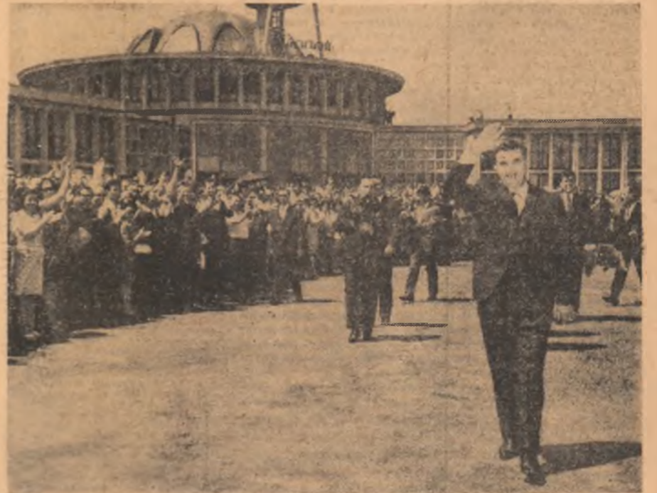
București, 18 iunie. Mii de locuitori ai Capitalei au venit în întîmpinarea conducătorilor iubii manifestîndu și adevărată deplină la politica partidului.

Miercuri dimineața s-a înaintat în Capitală delegația Partidului Comunist Român, condusă de tovarășul Nicolae Ceaușescu, secretar general al C.C. al P.C.R., care a participat la Consfătuirea internațională a partidelor comuniste și muncitorești de la Moscova.