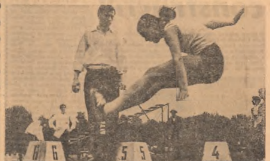
Aspect din întrecerea de atletism ale Campionatelor școlare