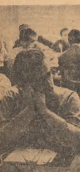
Exponerile sînt urmărite cu interes

retului Liberal din Danemarca. Călea cea mai directă spre securitatea europeană este cea a contactelor între popoare. Să ne cunoaștem, să facem comerț, să realizăm schimburi de valori spirituale, să parcurgem împreună drumul spre cunoaștere. Într-un asemenea climat, problemele dificile, ca cea germană, vor putea fi rezolvate, iar suspiciunile care au alimentat blocurile ostile vor dispărea. Țările mici trebuie să acționeze cu perseverență în această direcție, pentru că numai astfel ele își vor putea promova o politică proprie, independentă“. Firește,