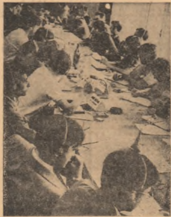
În jurul aceleiași mese, tineri de cele mai diferite orientări politice din 26 de țări europene