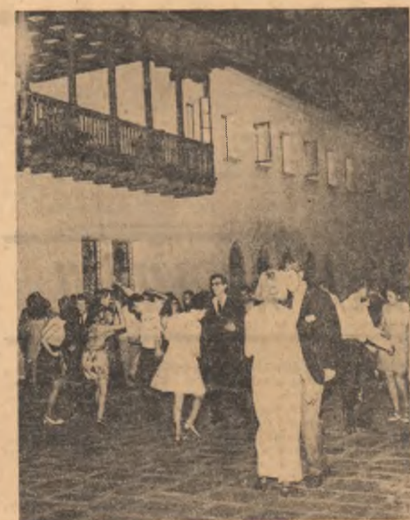
În timpul seratei prietenești de miercuri

Anchetă realizată de DOINA TOPOR și BAZIL ȘTEFAN