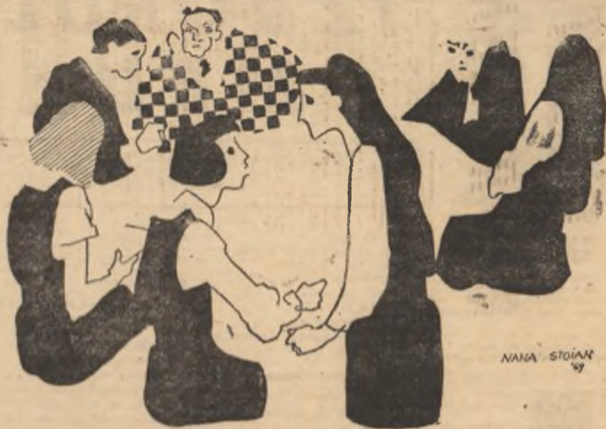
Cenacu — Desen de NANA STOIAN, Liceul de arte plastice — București