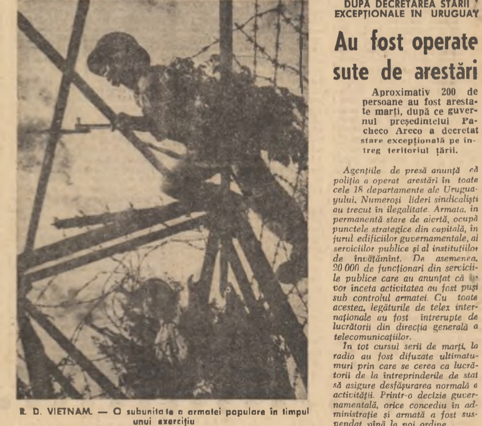
R. D. VIETNAM. — O subunitate a armatei populare în timpul unui exercițiu

dicția de circulație pe timpul nopții. ● CAIRO. — Consiliul Ligii Arabe urmează să se întrunească în sesiune extraordinară pentru a examina cererea Organizației pentru Eliberarea Palestinei de a prăbuși bugetul fixat pentru ajutorarea activității O.L.P. în teritoriile ocupate de Israel, anunță ziarul „Al Akhbar”. Conducerea O.L.P. a cerut țărilor arabe să aloce din bugetul lor o anumită cotă pentru finanțarea ajutorării materiale a palestinienilor și a activității O.L.P. ● AMMAN. — Primul ministru al Iordaniei, Abdel Moineim Rifai, a avut marți o întîlnire cu Hassan Sabri el Khlofi, reprezentantul personal al președintelui Republicii Arabe Unite, Gamal Abdel Nasser, care se află într-o vizită oficială la Amman. În cadrul unei conferințe de presă, Hassan Sabri el Khlofi a de-