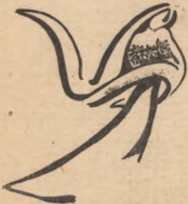
„Primăvara” Desen de: DOINA IGNEA