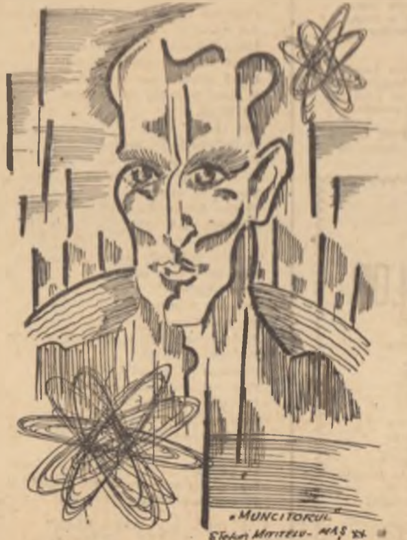
„Muncitorul“ Desen de : ȘTEFAN MITITELU