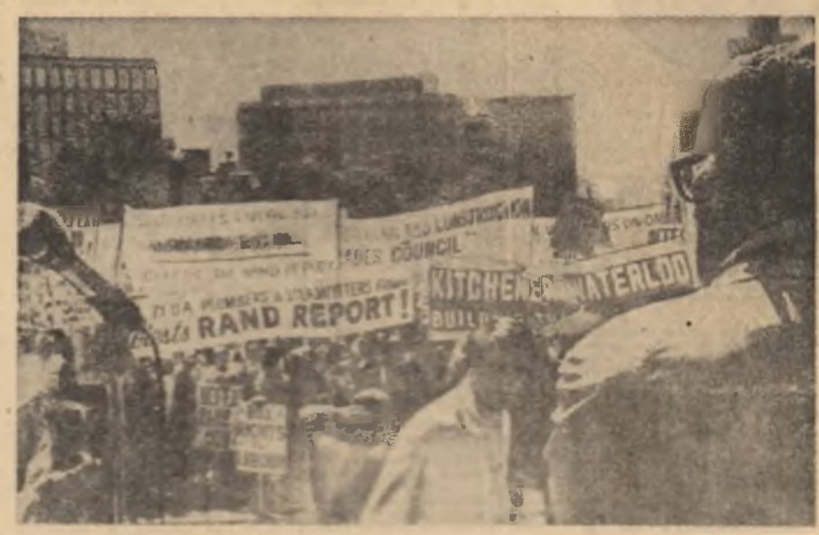
CANADA — Manifestația la Toronto în sprijinul unor revendicări economice

Astfel, obuzele patrioților au lovit în plin cartierul general al celei de-a doua regiuni tactice, o unitate de artilerie, o stație radar și un pod. De asemenea, rachetele au lovit de forțe patrimoniale au expresii în unități cartierului general al armatei americane de la Long Binh, și au distrus pozițiile de artilerie și ambarcațiuni de lăncieri la Ky Ky, precum și cartierul general al diviziei I americane la S.U.A. de la Phuoc Hoa. În același timp, avioane americane de tip B-57 au efectuat în ultimele 12 ore șapte