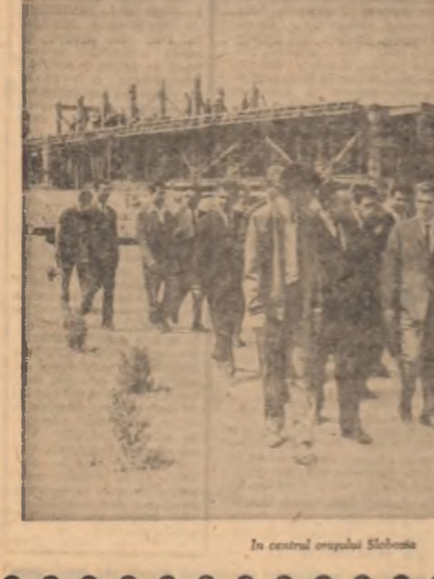
În centrul orașului Sibovia