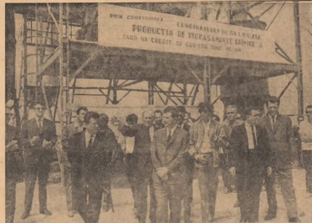
Pe șantierul Combinatului de îngrășăminte azotoase din Slobozia

Părăsind fabrica de ulei, secretarul general al partidului se îndreaptă spre oraș. Anul trecut, când tovarășul Nicolae Ceaușescu a mai vizitat Slobozia i-au fost prezentate proiectele de construcție a unui microoraion prevăzut în planul de dezvoltare și sistematizare a orașului. Astăzi, proiectele se înfăptuiesc. Aproximativ 400 de apartamente și-au primit locatarii, iar alte 1.200 apartamente sînt în con-