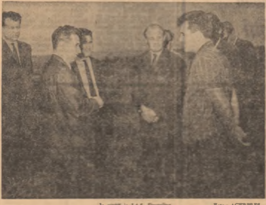
În câmp la I.A.S. Dragalina

Tovarășul Nicolae Ceaușescu atrage atenția asupra necesității de a se organiza în cele mai bune condiții munca de recoltare în întregul județ, de a se folosi din plin timpul prielnic, toate utilajele și forța de muncă de care dispune unitățile agricole, pentru a se evita orice pierderi de recoltă.