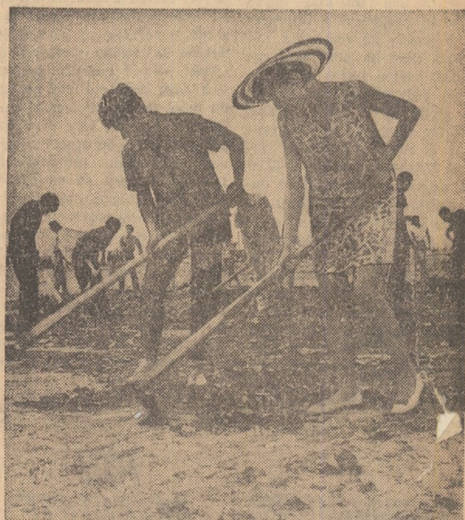
Începând de ieri, aproape 150 de studenți de la Universitatea și Politehnica din București, lucrează pe șantierul Pantelimon, „colegi” de vacanță cu elevii ai Liceului nr. 21, într-o devenire a lacului ce va fi curînd unul dintre cele mai pitorești locuri de agrement ale Capitalei