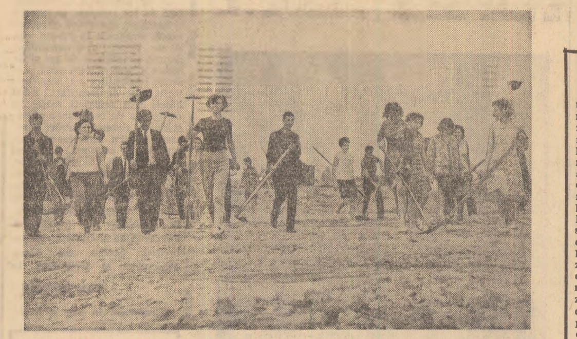
La începutul zilei, către locul de muncă, gata de asalt!