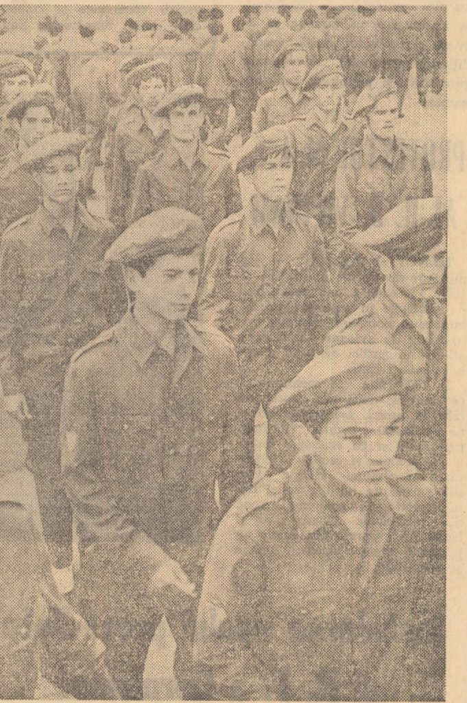
După prima cunoștință, prima defilare...

Adunarea generală a comunistilor din grupul de azot a constituit prilejul unei temeinice analize a muncii depusă de către organizația de partid, de întregul colectiv de la începutul anului și pînă în prezent. Materializate într-un avănușit și eficient plan de măsuri tehnico-organizatorice, într-o evidențiere a direcțiilor către care va trebui să fie îndreptată atenția colectivului în viitor, cuvintele celor prezenți ni s-au părut manifestarea unui spirit de înaltă răspundere și de competență de care dau dovadă întotdeauna comunistii, spirit propriu partidului nostru. Așadar, fără a avea pretenția unui tablou complet ne-am notat în ordinea celor spuse: întărirea disciplinei în muncă, aceasta presupunînd o comportare demnă în procesul de producție pe toate planurile; un continuu spirit de exigență pentru propriul nivel de calificare; atenția nelăbiată reducerii consumurilor specifice; desfășurarea tuturor forțelor pentru a produce cât mai curînd la capacitatea proiectată.