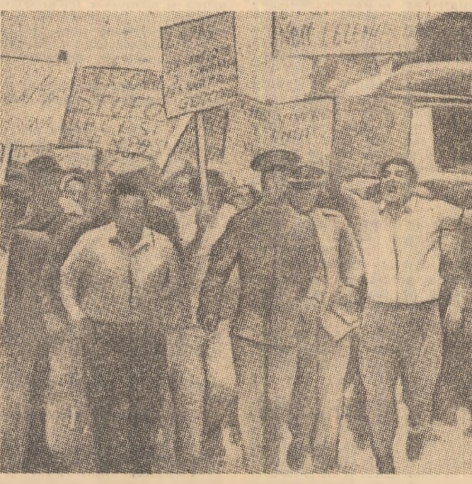
ITALIA. Aspect de la o demonstrație a lucrătorilor unei agenții de asigurări sociale, care a avut loc recent la Roma

În intervenția sa Aldo Moro a criticat cu vehemență politica actuală a partidului, calificînd situația din cadrul P.D.C. drept „insuportabilă”. Cît privește răspunsul majorității la aceste critici, el a fost destul de echivoc. Mariano Rumor și Flaminio Piccoli, au susținut Congresului o motiune finală în care este reafirmată dorința de a se continua actuala formulă a unui guvern de cen-