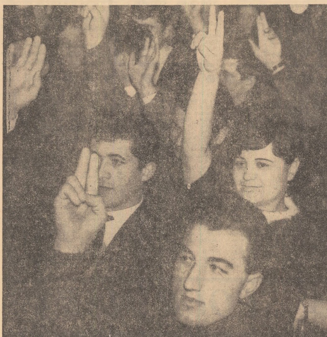
Rod al gîndirii colective, programul de activități a fost adoptat în unanimitate. Tot în unanimitate tinerii îl vor duce la îndeplinire