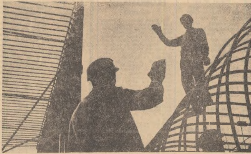
„Orizontale” și „verticale” la Porțile de Fier