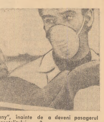
Mamifa-astronout „Bonny”, înainte de a deveni pasagerul bisatelului nr. 3