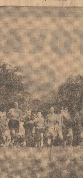
O filă din jurnalul vacanței: în tabăra de pionieri și școlari „Dîmbul Morii” cadru pitoresc îndeamnă la joc și bund dispoziție.

Cel mai puternic laser sînt creat și funcționează cu tonajul pămînturilor rare. Studiul nivelului de energie, propriu acestor lani, a asediat, la ora de față, spectroscopia și tehnica electronică.