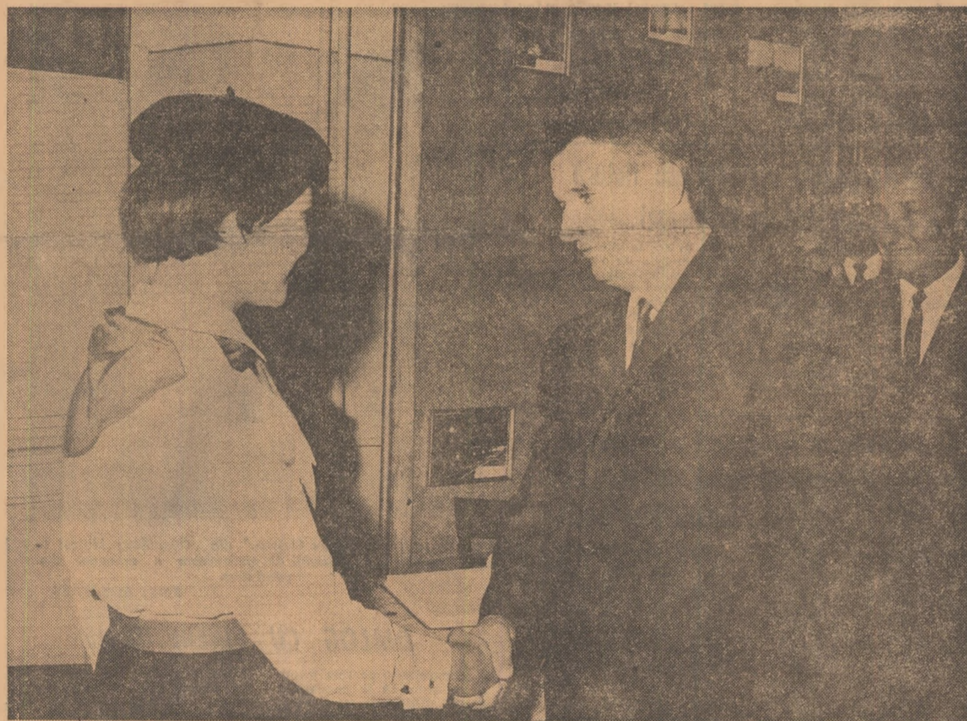
La Casa pionierilor

În continuare se prezintă planul de perspectivă al con-