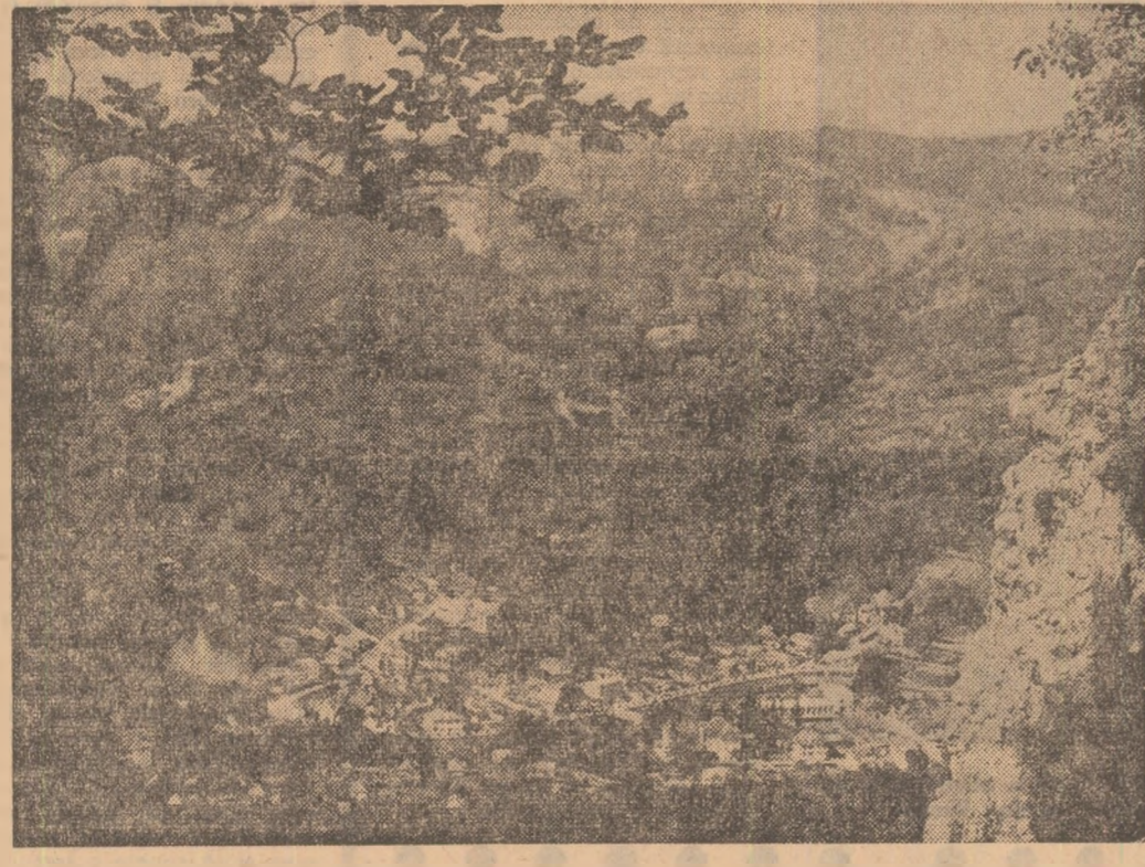
Vedere din Olănești