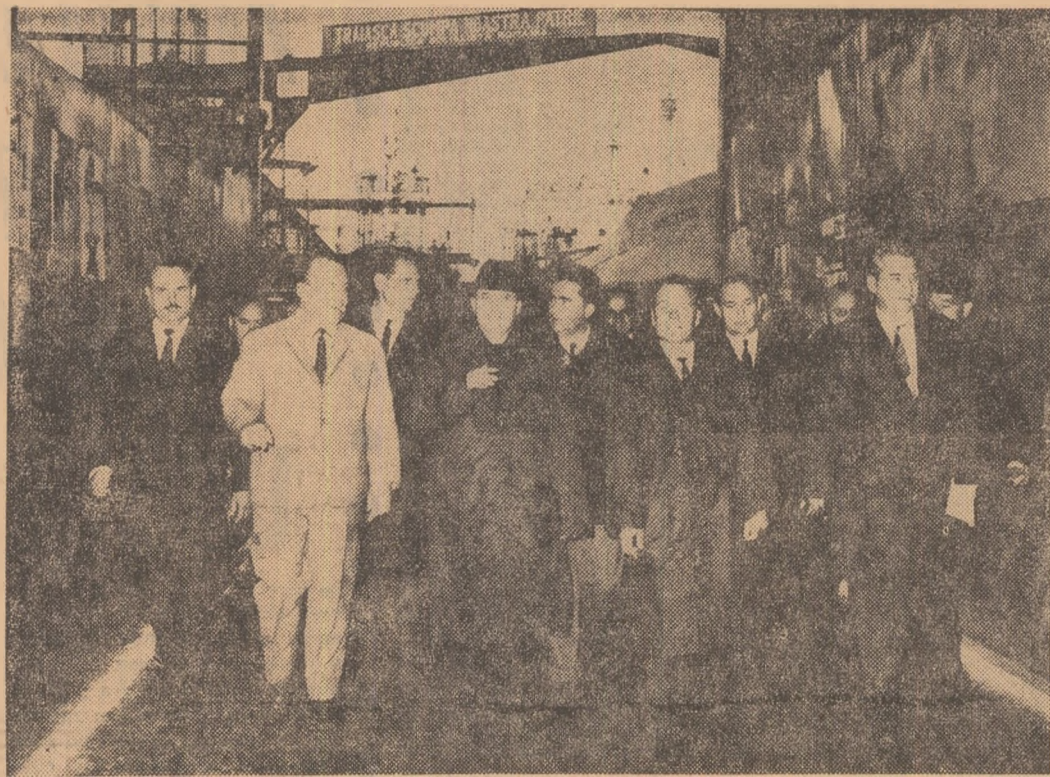
În incinta șantierului naval

Se merge apoi la șantierul fabricilor de ulei și de bere aflate în imediată vecinătate. Construirea acestor importante unități ale industriei alimentare va pune în valoare cu o eficiență ridicată materiile prime — floarea-soarelui, orz, orzoaică — produse în cantități tot mai mari de unitățile agricole din județ. Fabrica de ulei urmează să producă anual 50.000 tone ulei și 40.000 tone sroturi. Lucrările de construcție a fabricii de ulei sînt în avans față de grafic. Hala secției de prese prevăzută inițial pentru 1 septembrie, va fi terminată la 15 iulie, potrivit angajamentelor luate de constructor în cinstea