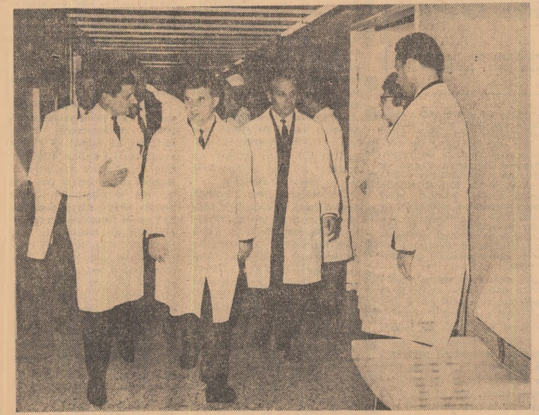
În modernul edificiu al Spitalului unificat