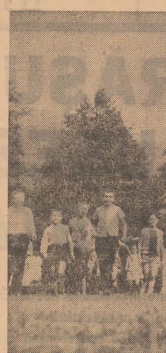
O filă din jurnalul vacanței: în tabăra de pionieri și școlari „Dîmbul Morii” cadru pitoresc îndeamnă la joc și bund dispoziție.

Cel mai puternic laser sînt creat și funcționează cu tonajul pămînturilor rare. Studiul nivelului de energie, propriu acestor lani, a asediat, la ora de față, spectroscopia și tehnica electronică.