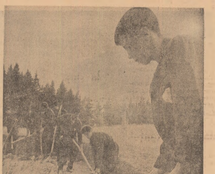
Elevii de la liceul „Dinicu Golescu” din Cîmpulung Muscel la muncă patriotică pe șantierul de modernizare a drumului din pasul Bran.