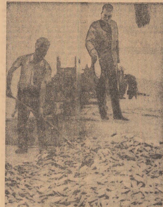
La Düsseldorf (R.F.G.), serviciile poliției fluviale adună mii de pești ucizi ca urmare a otrăvirii apelor Rinului

O AMPEĂ ACȚIUNE POLITICĂ și a forțelor speciale de securitate a fost declanșată miercuri în Țara Galilor, ca urmare a continuării seriei de atentate organizate de mișcarea separatistă naționalistă din această regiune a Regatului Unit.