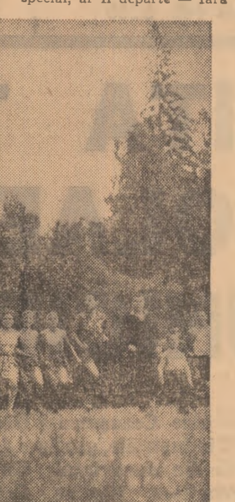
O filă din jurnalul vacanței: în tabăra de pionieri și școlari „Dîmbul Morii” cadru pitoresc îndeamnă la joc și bund dispoziție.

Cel mai puternic laser sînt creat și funcționează cu tonajul pămînturilor rare. Studiul nivelului de energie, propriu acestor lani, a asediat, la ora de față, spectroscopia și tehnica electronică.