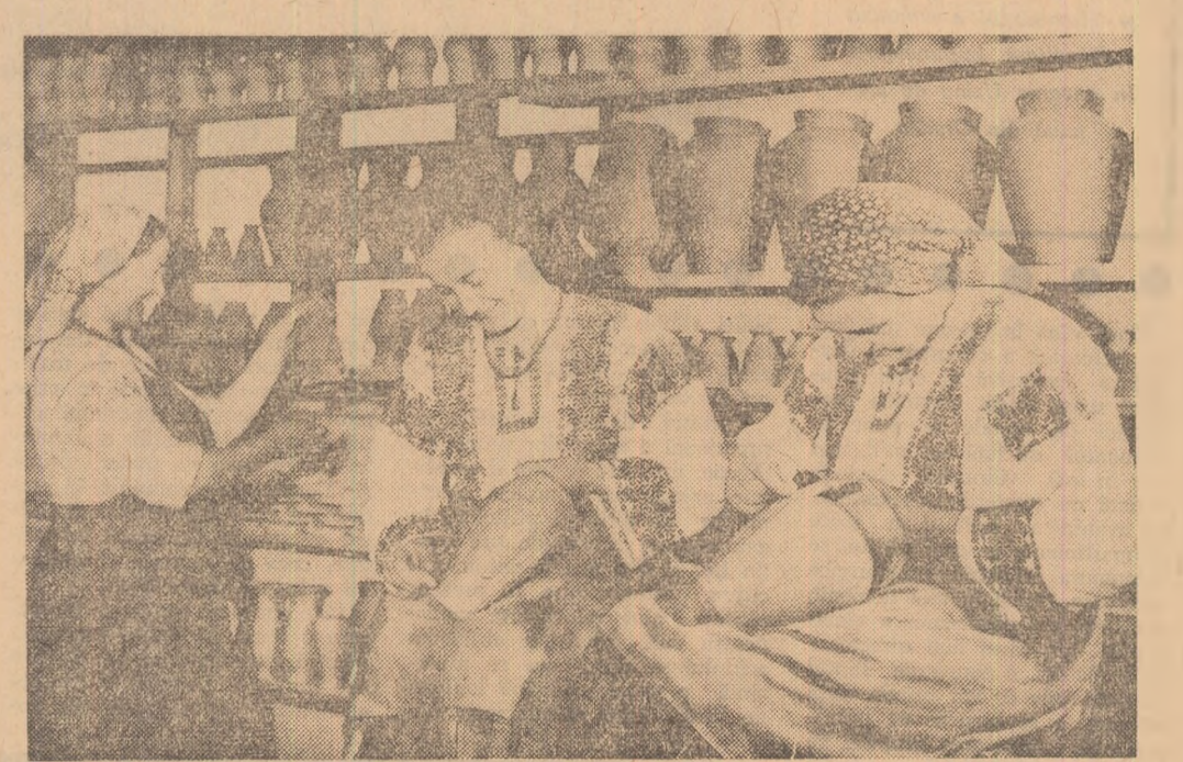
Olăritul — artă străveche a meștegurilor noastre — își perpetuează în ani frumoșii