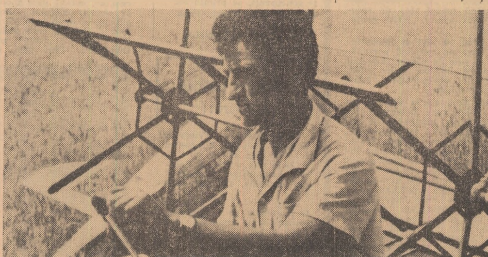
Serierul e în toi. Combinatele, conduse de miini harnice, lucrează din plin