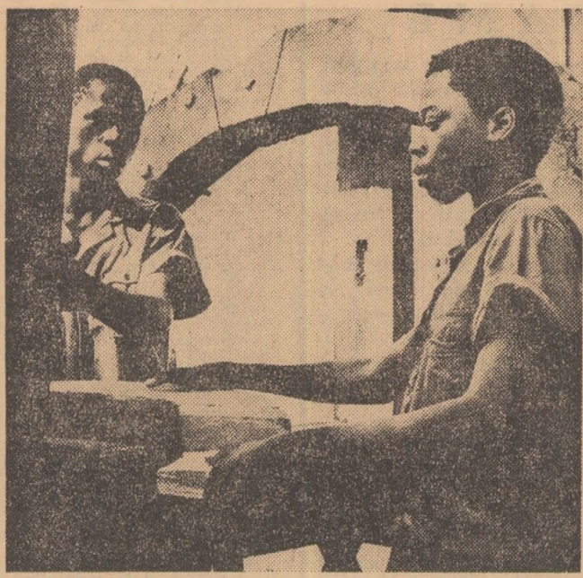
La un centru de formare profesională, creat cu sprijinul Biroului Internațional al Muncii în Mali

În ceea ce-l privește, guvernul Republicii Socialiste România respectă întru totul prevederile rezoluțiilor Adunării Generale și O.N.U. și ale Consiliului de Securitate în problema politicilor de apartheid promovate de guvernul Republicii Sud-Africane și nu întreține relații diplomatice, consulare, politice sau economice cu autoritățile de la Pretoria.