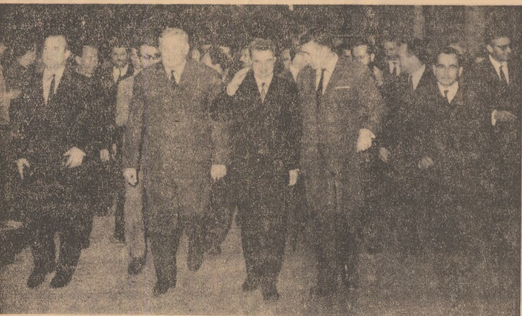
Tovarășul Nicolae Ceaușescu vizitînd Uzinele „Industria Sîrmei” din Cimpia Turzii