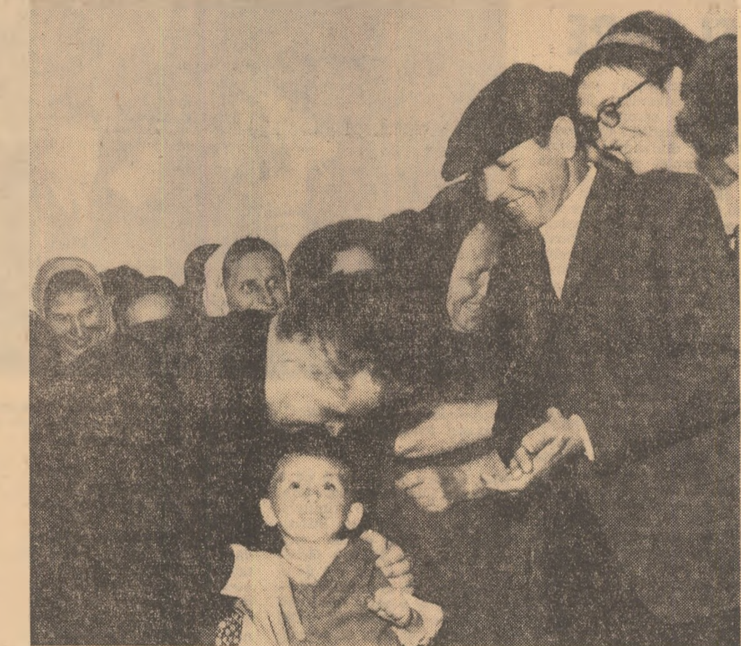
Moment emoționant! Tovarășul Nicolae Ceaușescu îmbrățișează cu dragoste pe unul dintre cei mai mici locuitori veniți în întâmpinarea sa

Fără a ține seama de ploaia persistentă, masa compactă a cetățenilor prezenți de-a lungul întregului traseu parcurs freacă și își exprimă prin urale dragostea neîntinșată față de Partidul Comunist Român, față de Comitetul său Central, în frunte cu secretarul general al partidului „P.C.R. — P.C.R.”, „Ceaușescu — Ceaușescu”, răsună scandările neîntrerupte ca o vie intruchipare a puternice legături care unește indestructibil, energiile întregului popor de politica partidului. Este o expresie elocventă a unității de nezdruncinată a tuturor cetățenilor acestei țări — români, maghiari și de alte naționalități — în jurul Partidului Comunist, al conducerii sale.