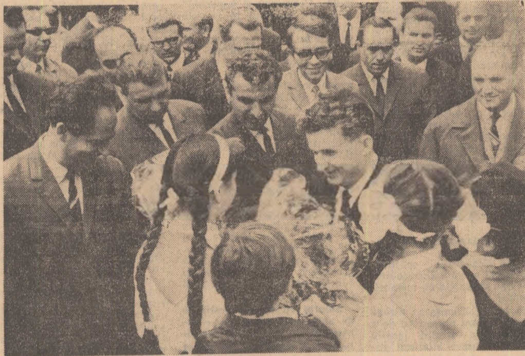
Flori pentru conducătorul iubit al partidului, tovarășul Nicolae Ceaușescu

Sînt nenumărate faptele, realitățile despre care ci pot vorbi Maramureșul a resimțit din plin urmările binefăcătoare ale înfăptuirii politicii partidului de industrializare a patriei, de repartizare teritorială judicioasă a forțelor de producție pe tot cuprinsul țării. O singură cifră este deosebit de grăitoare: în numai 24 de zile, județul realizează astăzi întreaga producție industrială a anului 1938. Construirea unor puternice obiective industriale, ridicarea la puteri superioare a celor vechi, au făcut ca industria maramureșeană să înscrie cote merite mai înalte pe graficul economiei naționale. Noile exploatare miniere, Uzina centrală de preparare a mineralelor din Baia Mare, Uzina de preparare Sasar-vest, floatale de la Băiut și Baia Borsa. Combinatul chimico-metalurgic, Uzina „I Mai”, Uzina mecanică de mașini și utilaj minier, întreprinderile forestiere de la Tirgu Lăpuș,