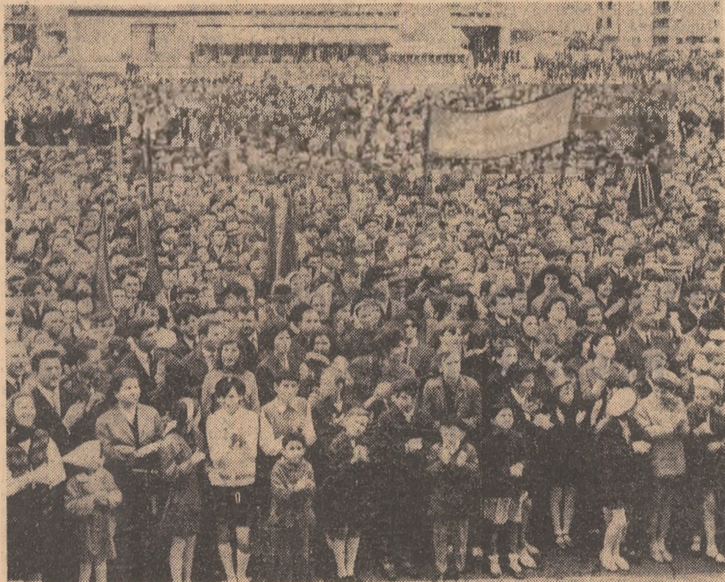
În timpul mitingului de la Bato Mare