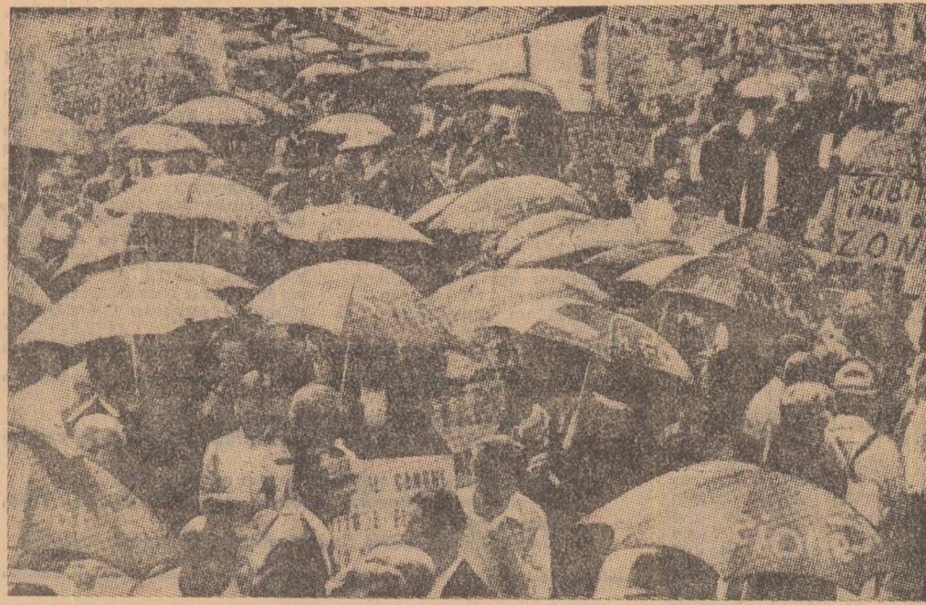
Aspect de la o demonstrație revendicativă care a reunit la Roma reprezentanți ai agricultorilor din toate regiunile Italiei

In cursul nopții de marți spre miercuri, forțele Frontului Național de Eliberare din Vietnamul de sud au bombardat 16 poziții ale trupelor americano-saigoneze — relatează corespondentul agenției FRANCE PRESSE. Acțiunile ofensive declanșate de patrioții au fost concentrate asupra instalațiilor militare definite de trupele inamice în sectoarele Phan Thiet, Ban Me Thuot, Phuoc Vinh și Rach Gia.