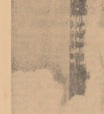
Sub privirile sutelor de milioane de spectatori și telespectatori, „Apollo-11” și-a luat zborul de pe rampa de lansare. Solii Terrei călătoresc acum în spațiile siderale spre o țintă care înflăcărează imaginația noastră, a tuturor

Sub privirile sutelor de milioane de spectatori și telespectatori, „Apollo-11” și-a luat zborul de pe rampa de lansare. Solii Terrei călătoresc acum în spațiile siderale spre o țintă care înflăcărează imaginația noastră, a tuturor