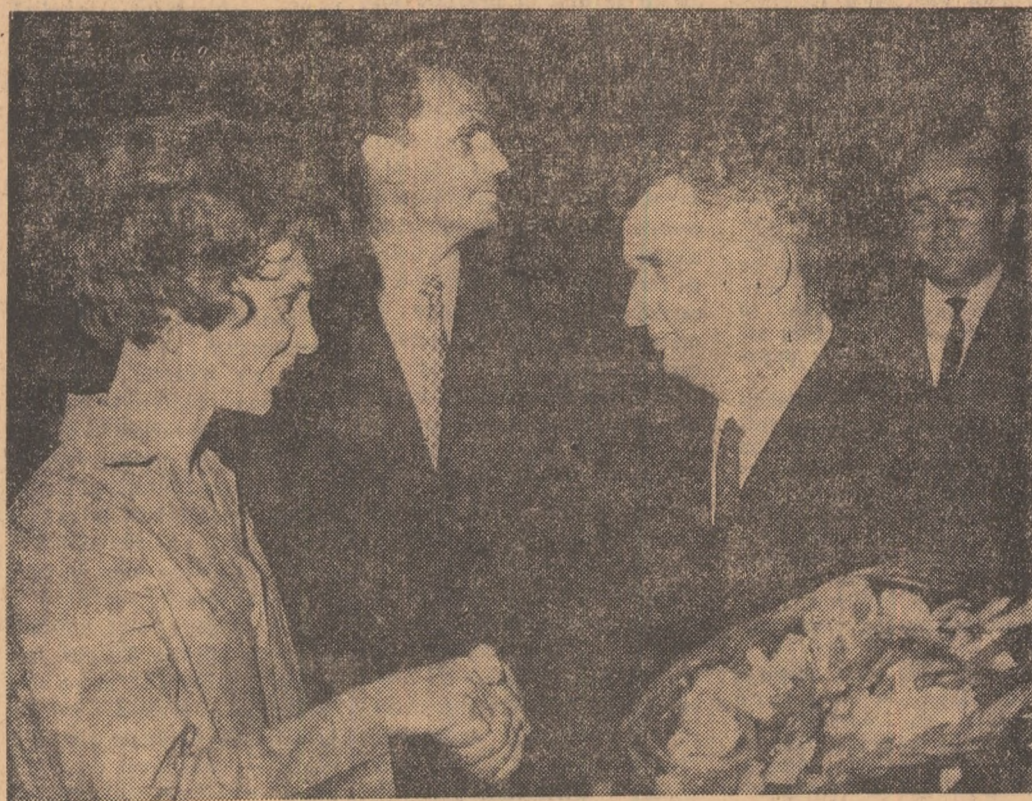
Tinerile muncitoare de la Fabrica „Argeșana” îl întîmpină cu multă căldură pe tovarășul Nicolae Ceaușescu

sionantă pădure de sonde, care avea să transforme aceste locuri într-o nouă zonă petroliferă a țării. Aici s-a înălțat una din cele mai mari și mai moderne hidrocentrale. De aici a pornit la drum, în august 1968, primul autoturism românesc, și tot aici, acum, în aceste zile, harnicii construc-