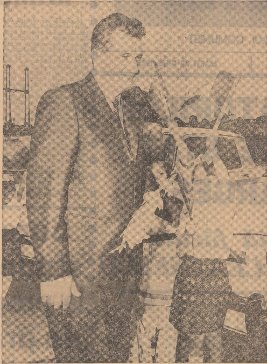
Cei mai tineri locuitori ai Piteștiului împreună cu conducătorul iubit al poporului, tovarășul Nicolae Ceaușescu

Nu departe de comuna Văleni se află stațiunea experimentală hortivitică din Ștefănești. Și aici, ca de altfel pe întreg traseul, locuitorii comunei au ieșit cu mic, cu mare să salute trecerea conducătorilor de partid. Steaguri tricolore și roșii flutură în vînt. O mare de urale întâmpină pe conducătorii iubiți. Mai departe, întîlnim o vie nesfîrșită, plantată pe dealuri odinioară sterpe. Mai mult de 5.000 de hectare au fost înnoablate prin strădaniile lucrătorilor din această stațiune. Podgoria și-a câștigat în scurt timp un renume de care, cei