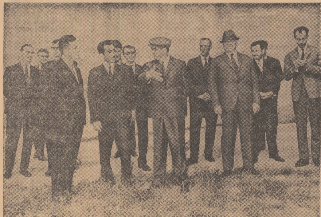
Vizitînd stațiunea experimentală hortiviticolă din Ștefănești