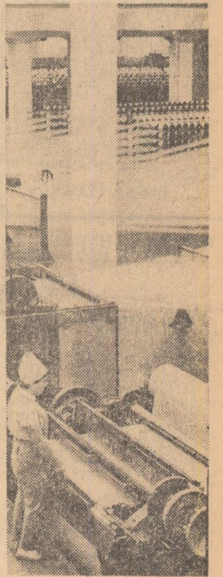
Intr-una din secțiile Uzinei de fibre sintetice din Săcinești

ÎN PAG. A 4-A ● EXPLORATORII LUNII S-AU REÎNTORS PE PĂMÎNT