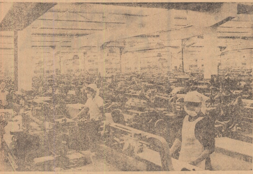
Din peisajul industrial al R.P.D. Coreene. Imagine de la unul dintre modelele combinate textile