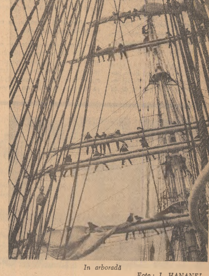
În arboradă

care ne-au căutat fie ca prieteni, fie ca dușmani. Tărmul nostru deschis în arcul albastru al Mării Negre este, în eremurile noastre, chemare de pace și bună vecinătate. Fiindcă acolo unde marea se împreună cu țăara și devine ea însăși țară, statornică și eternă, acolo sînt și ei, marinarii, ostași cu beretă albă și panglică fluturîndă culorilor albastru. Și-n uniforma lor se arată o stemă de 25 de ani, o stemă cu spîc și mînuși sub temelii cărora este scris numele țării; o stemă luminată de soare generos al socialismului, căruia acești sîneri împreună cu toți tinerii forțelor noastre armate, îi sînt, cu mîndrie, acest puternic, de neclintit. Concitate, evenimentele din viața marinarilor se înscriu în jurnalele de bord. Sînt acolo adunate comenzi, I. GHEORGHE (Continuare în pag. a V-a)