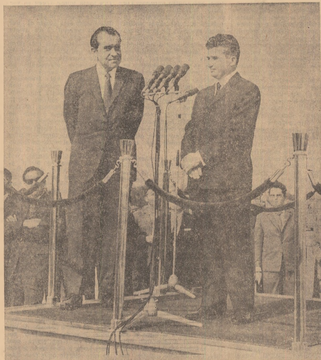
La plecare, pe aeroportul Otopeni