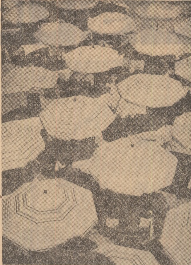
In ambianța litoralului

Au fost depuse jerbe de flori la plăcile comemorative. După amiază, tinerii au participat la serbarea cîmpenească organizată pe stadionul din Lupeni, care a cuprins un bogat program cultural-artistic și sportiv.