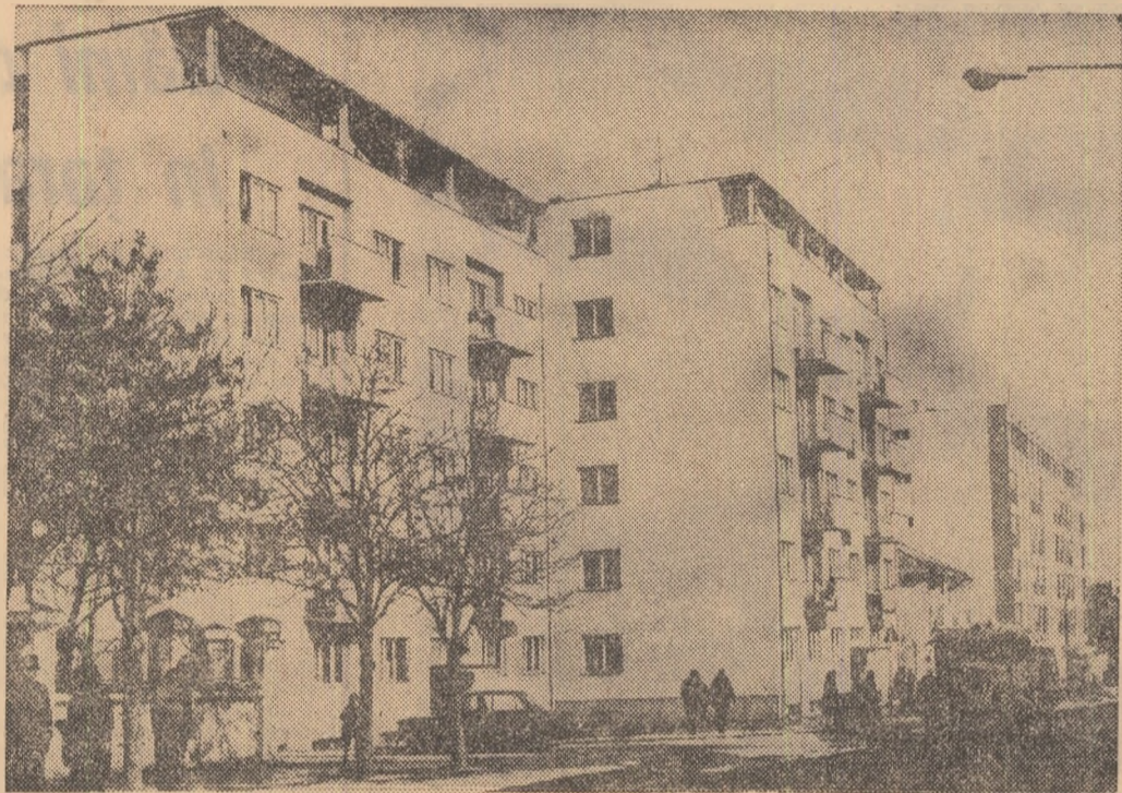
R. S. F. IUGOSLAVIA. Aspect dintr-un nou cartier al orașului Kumanovo

LONDRA. — Ministrul de ex- terne al Marii Britanii a dat pu- blicității o declarație în care și-a exprimat îngrijorarea profundă în legătură cu intensificarea in- cidențelor militare în zona Cana- lului de Suez și a morții în cursul unor astfel de incidente la 27 iulie a unui membru al corpului de observatori al O.N.U. Declarația britanică sprijin- ă un apel similar lansat de se- cretarul general al O.N.U., U Thant, și solicită părțile să de- pună eforturi în vederea unei re- glementări pașnice a situației din Orientul Apropiat.