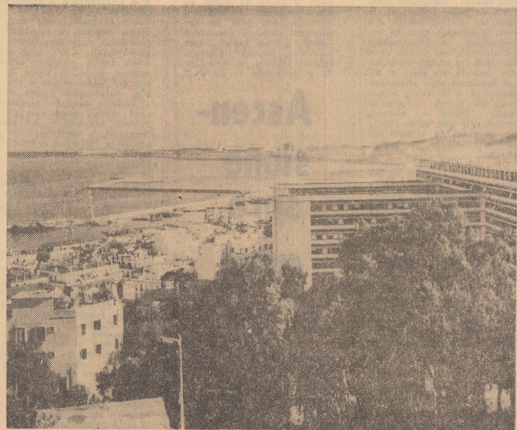
Vedere din Alger

După încheierea referendumu- lui, teritoriul Irianului de vest ră- mîne în mod oficial parte inte- grantă a Indoneziei.