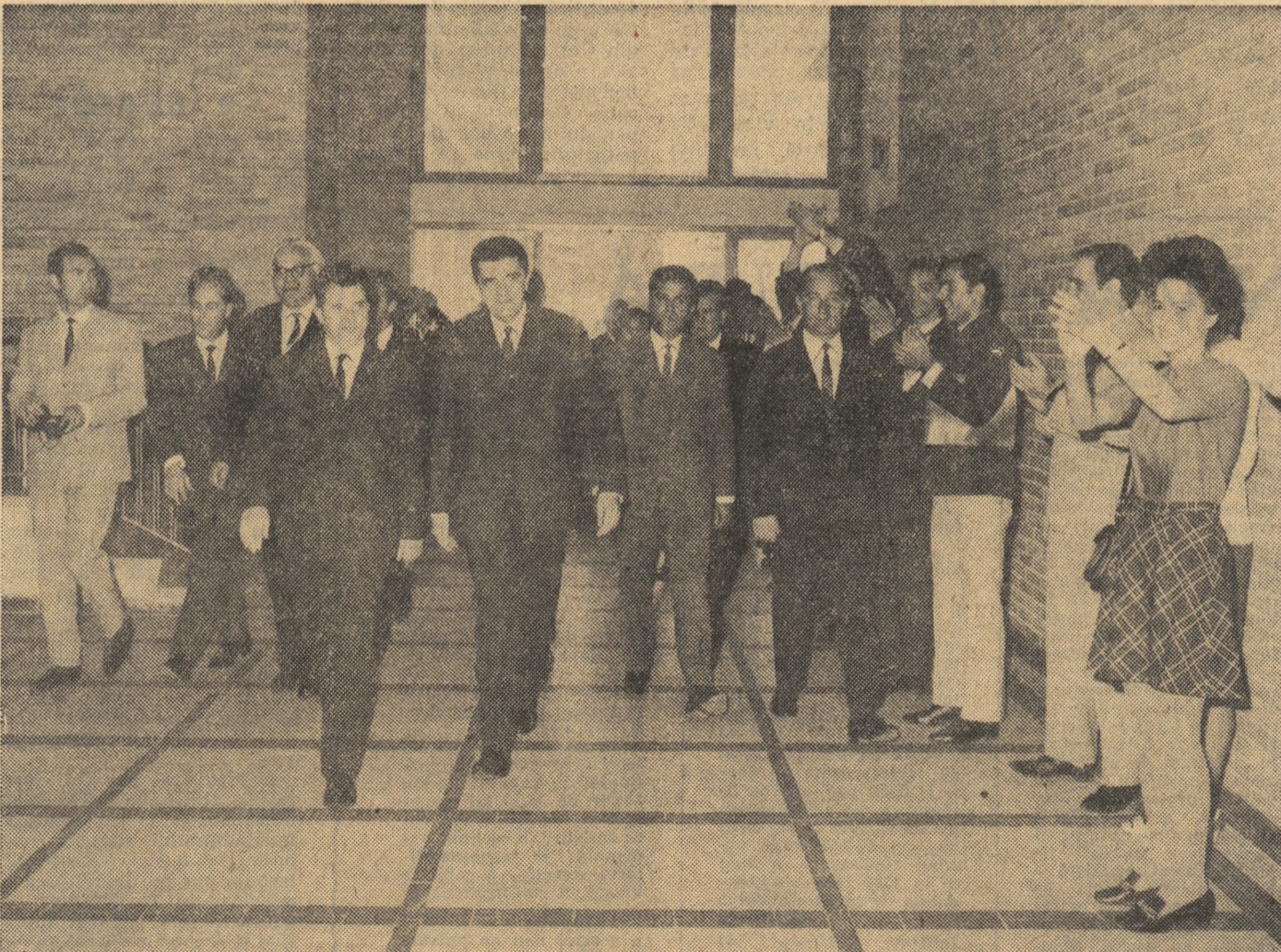
În noul local al Institutului politehnic

dragi tovarășii, studenții, Partidul comunist, guvernul țării, întregul popor dau o înaltă apreciere tineretului studentesc din patria noastră, crescut și format în condițiile orînduirii noi, devotat partidului, legat trup și suflet de interesele și aspirațiile poporului, ale societății noastre socialiste. La acest început de an universitar vă adresez vouă, tinerii studenți, îndemnul de a munci cu rivăna și pasiune pentru a cuceri grandioasa cetate a științei moderne, pentru a vă îmbogăți continuu mintea cu descoperirile ale genului uman, cu mărețele cuceriri ale cunoașterii contemporane. Sînt încredințați că veți depune toate eforturile pentru a vă îndeplini înaltele îndatoriri ce vă revin — și vă urăm din toată inima să încheiați anul pe care îl inaugurăm astăzi cu rezultate strălucite la învățămînt, cu noi realizări în pregătirea pentru muncă și viață. (Aplauze puternice).