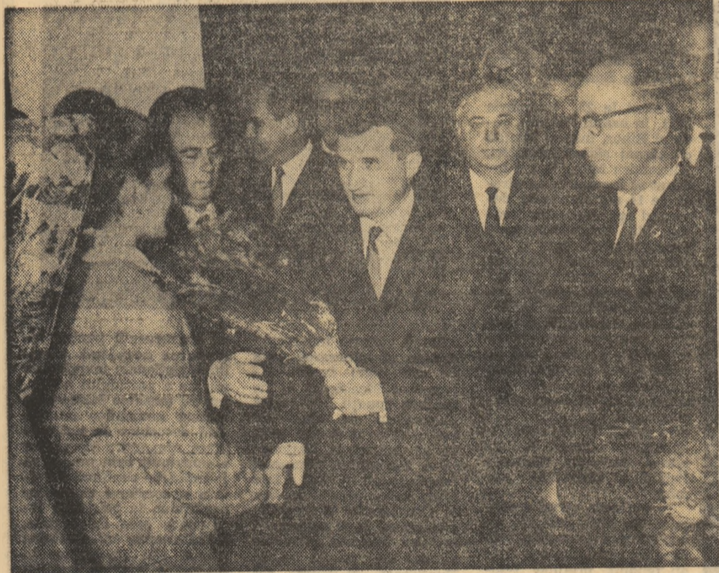
La Institutul de petrol și gaze

Vizita tovarășului Nicolae Ceaușescu în instituțiile de învățămînt superior din Capitală a constituit o nouă expresie a finalității preocupării a conducerii de partid și de stat pentru bunul mers al școlii superioare românești, a grijii permanente de a asigura perfecționarea activității ei în concordanță cu cerințele actuale și de perspectivă ale pregătirii noilor promoții de specialiști necesari economiei, științei și culturii noastre socialiste.