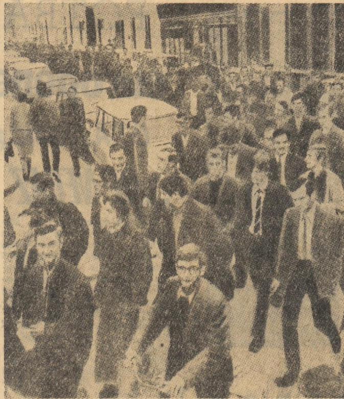
FRANȚA. — Aspect de la marșul factorilor poștali din Paris în cursul recentei lor greve