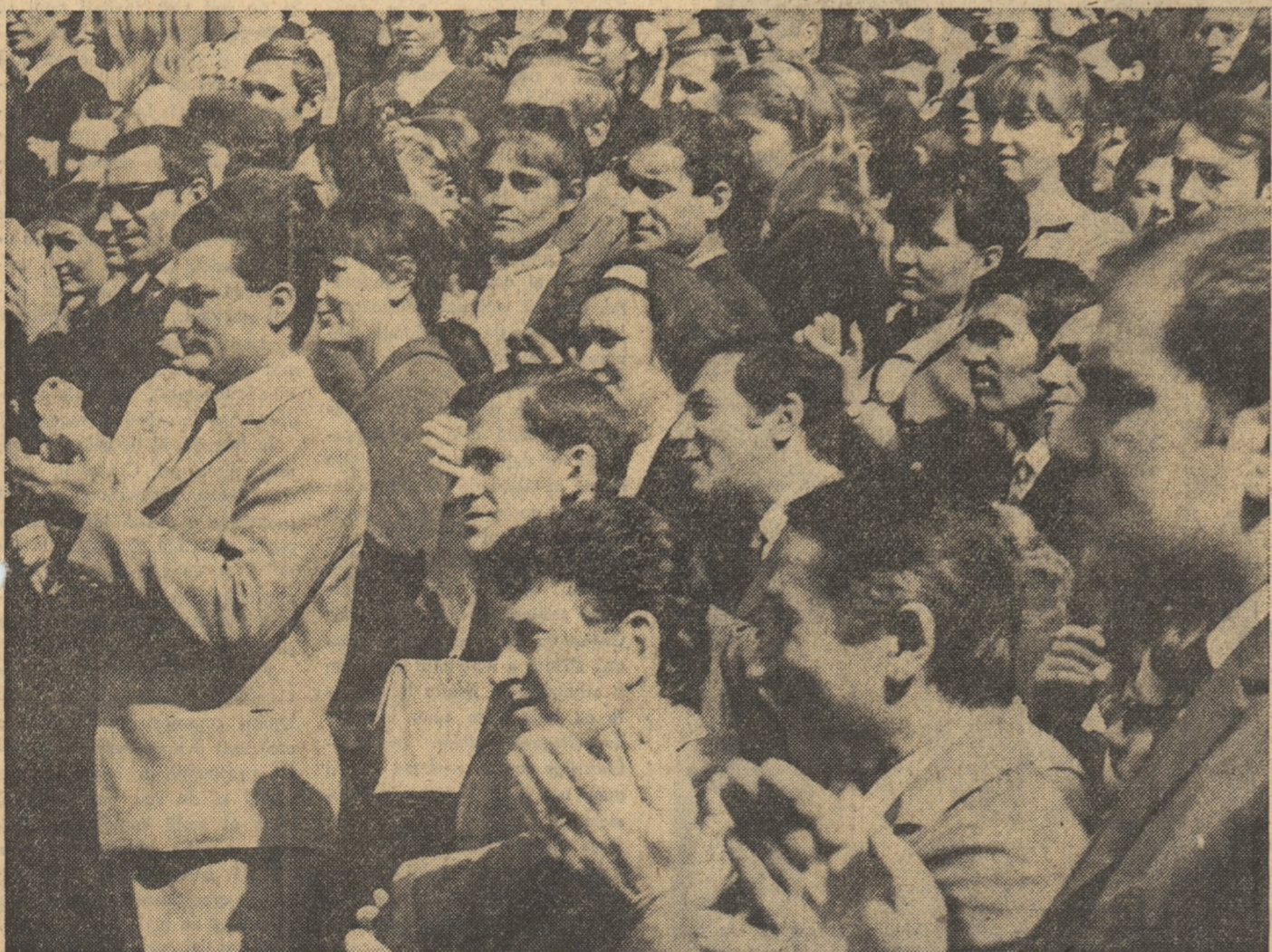
În Piața Romană