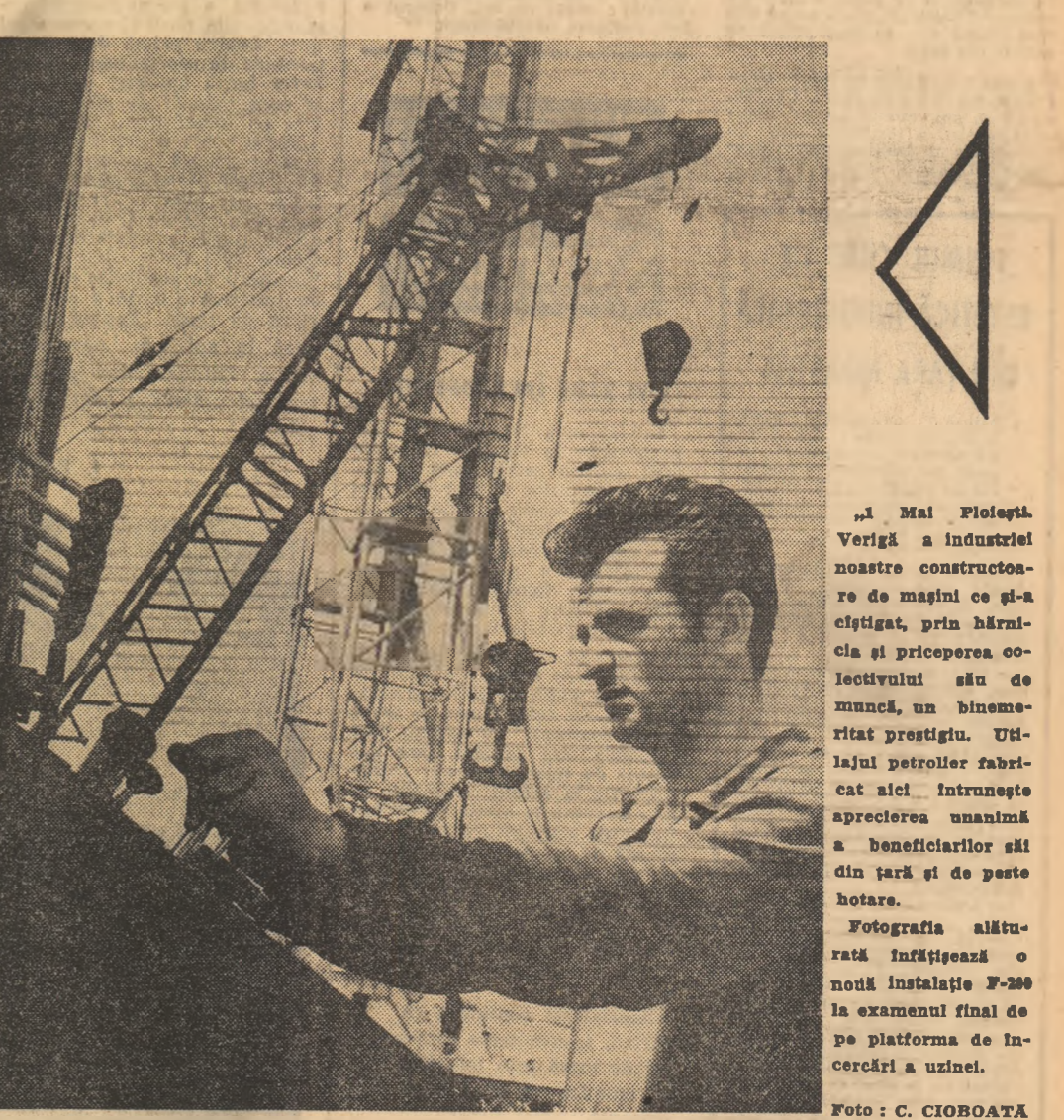
„I Mai Ploiești. Verigă a industriei noastre constructoare de mașini ce și-a câștigat, prin birnicia și priceperea colectivului său de muncă, un binemeritat prestigiu. Utilajul petrolier fabricat aici întruște aprecierea unanimă a beneficiarilor săi din țară și de peste hotare. Fotografia alăturată înfățișează o nouă instalație P-260 la examenul final de pe platforma de încercări a uzinei.