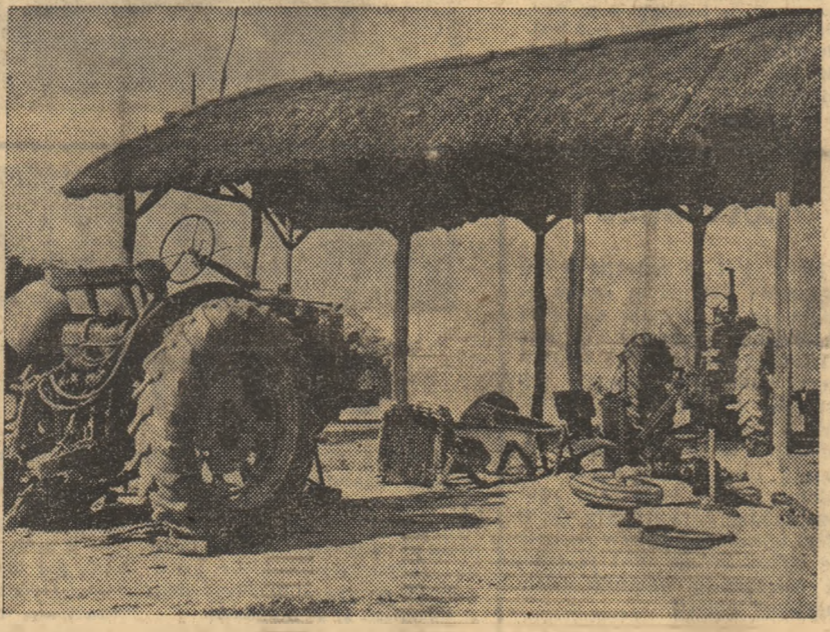
Aceste tractoare, aparținând I.M.A. Bărcăneștii, trebuiau să fie în câmp! Două tractoriști cheflii le-au adus în starea de fier vechi. Cine răspunde? Citiți amănunte în acheta brigăzii noastre

Alo, Bărcăneștii, se vede? Cele două imagini surprind aspecte din două secții de mecanizare diferite. Prima, secția din Puchenii Mari. Două tractoare scoase din lan, unul de 5 (cinci!) altul de 3 zile sau pe butuci. Și cit vor mai sta nu se știe. Fiindcă, din neputința cu care încercăm să găsim defecțiunea, am