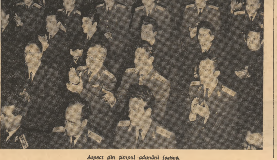
Aspect din timpul adunării festive.

Ca ocazia sărbătoririi celei de-a 25-a aniversări a Zilei Forțelor Armate, pentru contribuția adusă la întărirea Forțelor Armate ale Republicii Socialiste România, prin decret ale Consiliului de Stat au fost distincții cu ordine și medaliile un număr de 2300 de generali, ofițeri, maiștri militari, subofițeri și salariați civili. Înaltele distincții au fost înmînate în cadrul unor solemnități, care au avut loc, vineri, la Casa Centrală a Armatei din Capitală și în garnizoanelor militare din țară. (Agerpres)