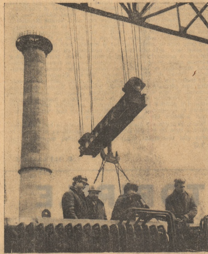
Pe șantierul Centralei termo- electrice din Constanța