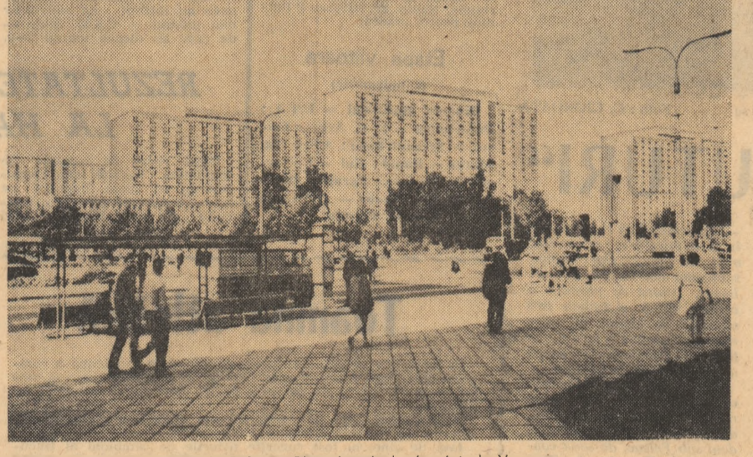
R. P. Polonă. Blocuri noi de locuințe la Varșovia