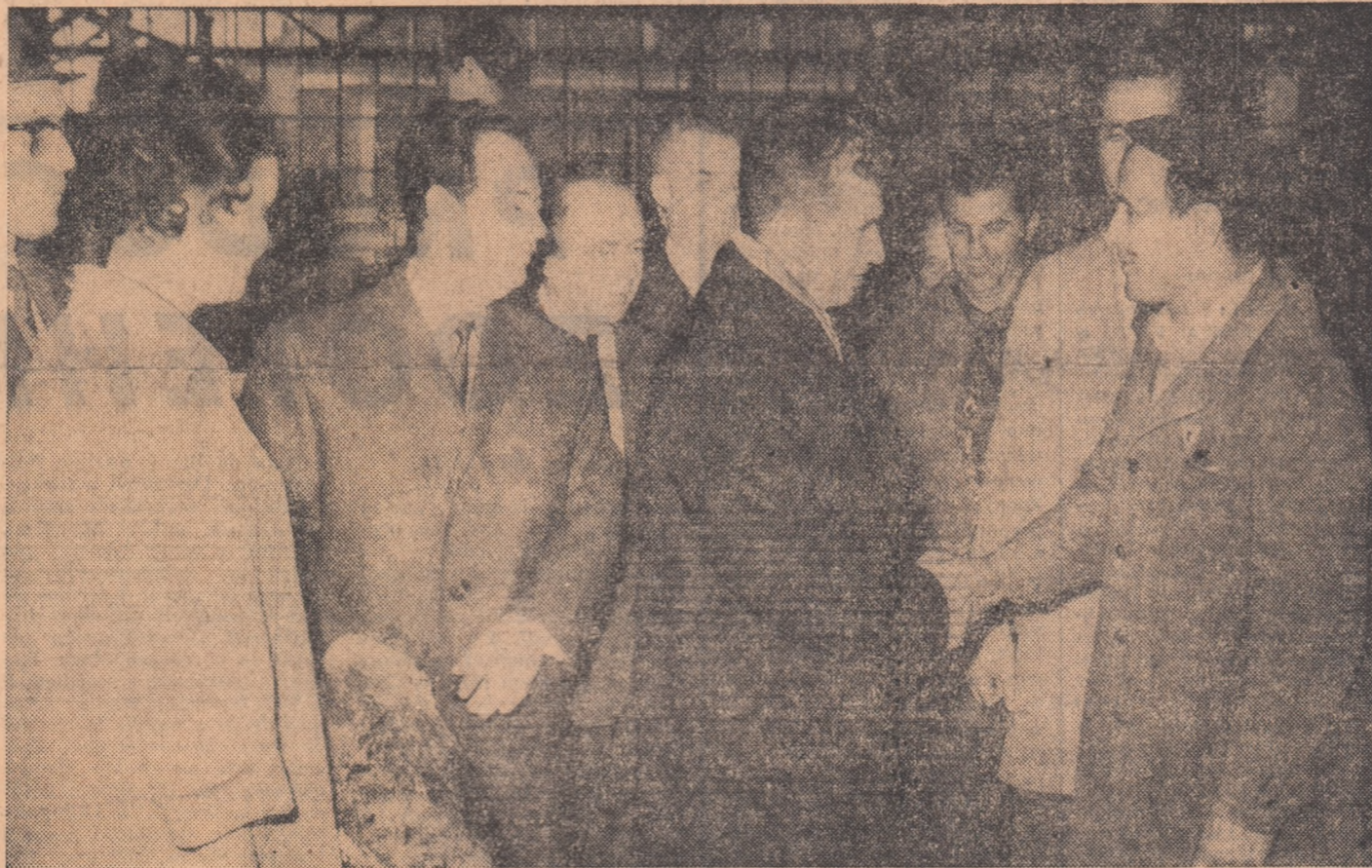
Prețutendenți, muncitorii întimpină cu deosebită căldură pe secretarul general al partidului.

Sunt vizitate apoi secțiile prese, punți și diferențiale și secția de montaj. Și aici oaspeții sunt informați asupra realizărilor, a preocupărilor de dezvoltare a capacității de producție și de perfecționare a organizării fluxului tehnologic. Îngăz bandă de montaj, de