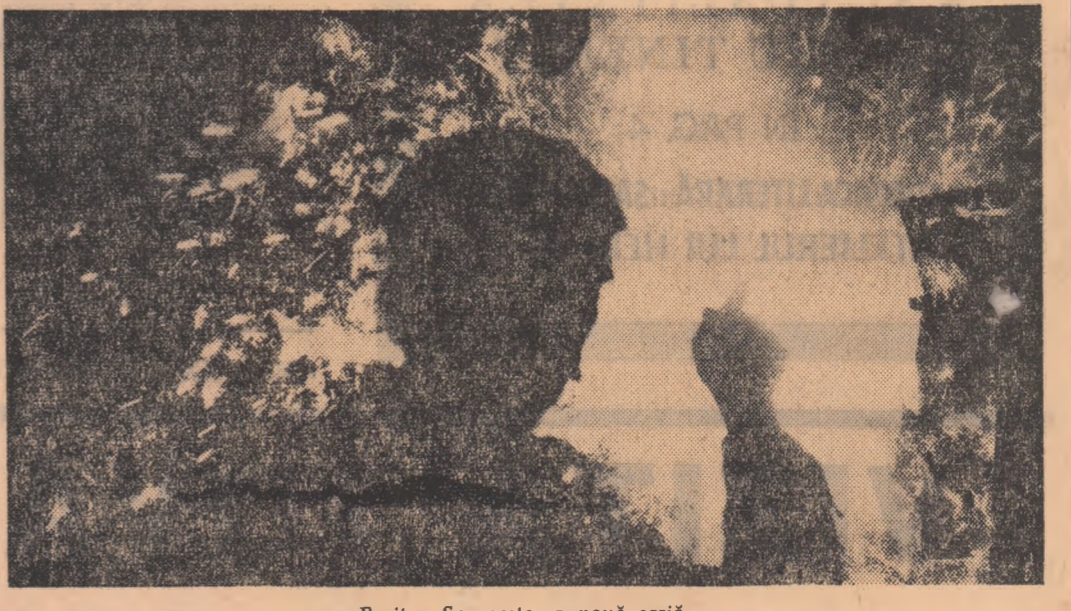
Reșița. Se naște o nouă generație