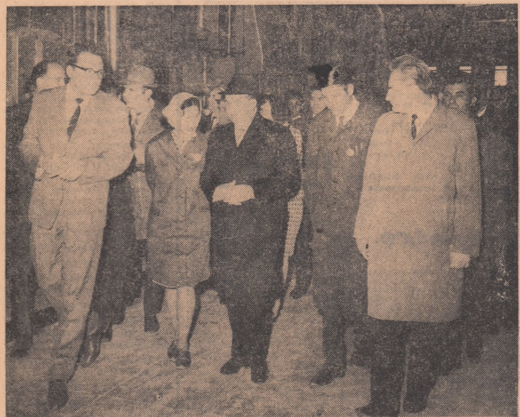
Intr-una din modernele secții ale Uzinei de autocamioane.

La despărțirea de colectivul constructorilor de autocamioane, secretarul general al partidului li felicită pentru realizările îndeplinite, le urează să valorifice și mai bine condițiile create, potențialul uman și material existent, astfel încit să se dovedească mereu la înălțimea sarcinilor de onoare pe care le au de îndeplinit, să crească prestigiul pe care și l-au dobîndit în ultimii ani.