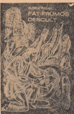
Florea Fugaru: „FĂT-FRUMOS DESCULT”

Baba i-a răspuns scurt, cu dușmănie: / - Ce să fie, Ștefane? Păcate! Plătim toți pentru unu, că Dumnezeu n-alege. II bate pe toți / Moș Ștefan fura cu sacul din cimp... A răspuns repede. / - Ce-i pasă lui de ce face-măcăm în țara lui? Furam de la el? Am fura și de la el, dar n-ajungem, că stă sus și n-avem scâră.”