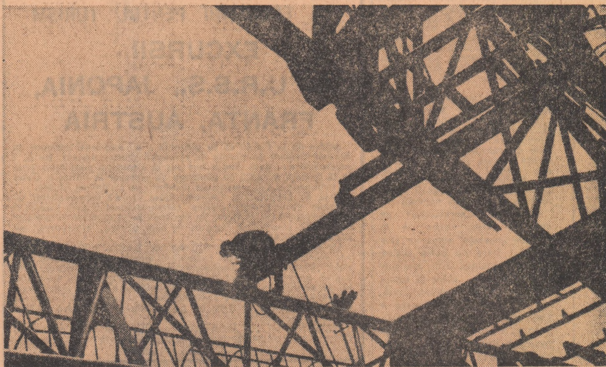
„Sondă în lucru” — Uzinele „1 Mai” — Ploiești