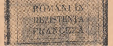
ROMÂNII ÎN REZISTENȚA FRANCEZĂ