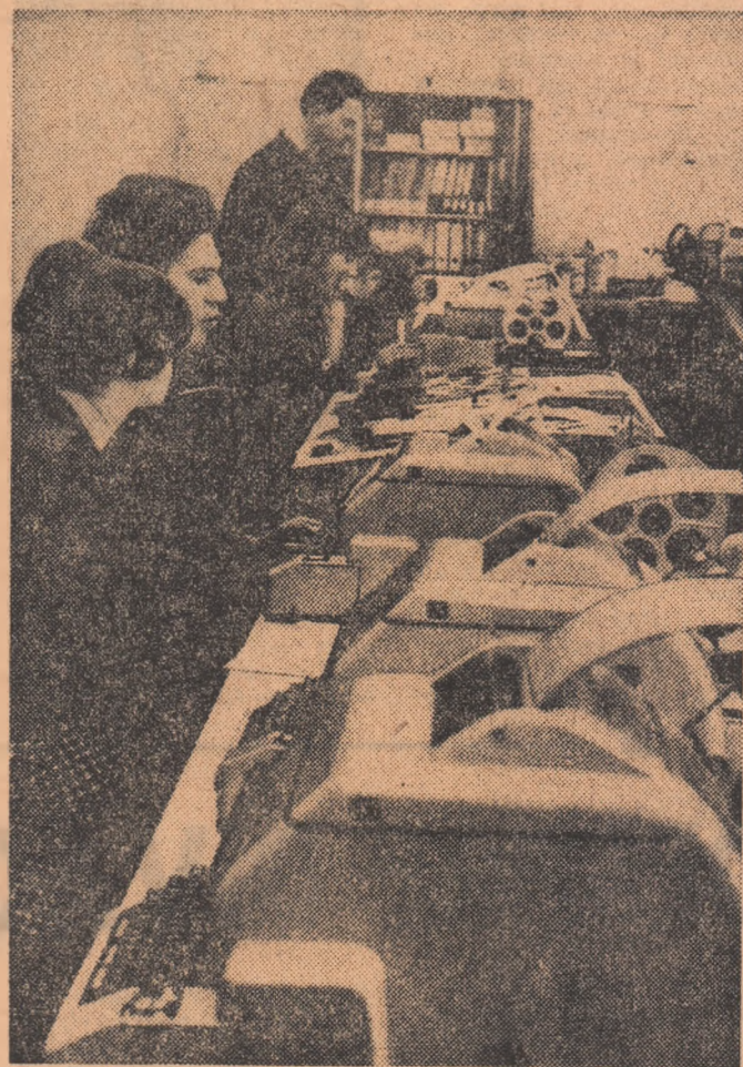
Combinatul siderurgic Galați. Imagine de la secția de calcul.