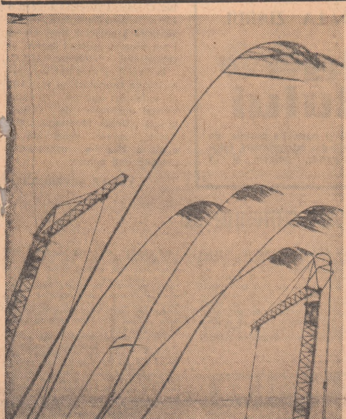
Două fotografii de ION CUCU