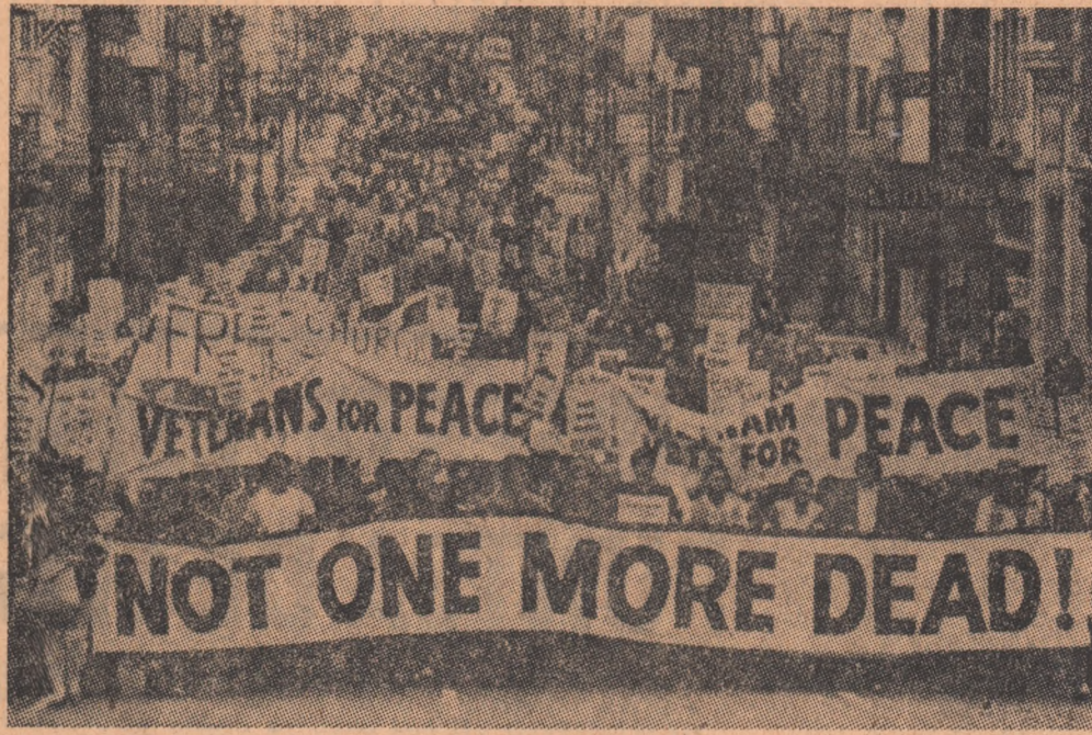
S.U.A.: Demonstrație la San Francisco pentru încetarea imediată a intervenției americane în Vietnam. Pe pancarta mare purtată de demonstrații scrie: „Nici unul să nu mai moară!”.

În cursul convorbirilor au fost abordate probleme privind relațiile bilaterale româno-britanice, precum și aspecte ale situației internaționale, printre care problema securității europene, problema vietnameză, situația din Orientul Apropiat, rolul și activitatea Organizației Națiunilor Unite.