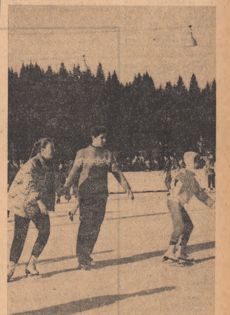
Sub același soare primăvătaț încă, la Poiana Brașov ca și la București, tinerii patmatori asaltează patinoarele artificiale.