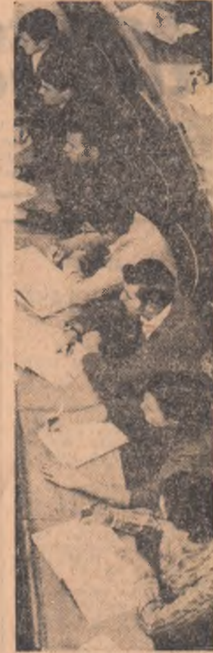
Intr-unul din amfiteatrele noi politelmei din București