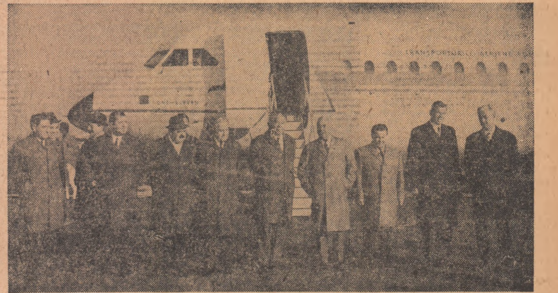
La sosire, pe aeroportul Băneasa