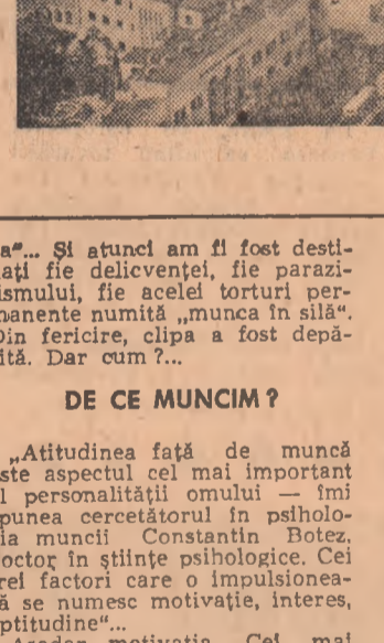
Imagine din Satu Mare.

„NUMI PLACE SA MUNCESC” (continued) - discussing the social and personal aspects of work and education.