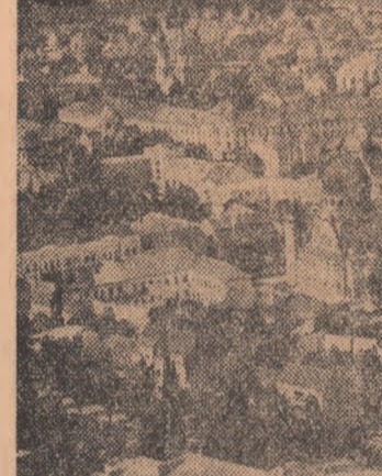
Imagine din Satu Mare.