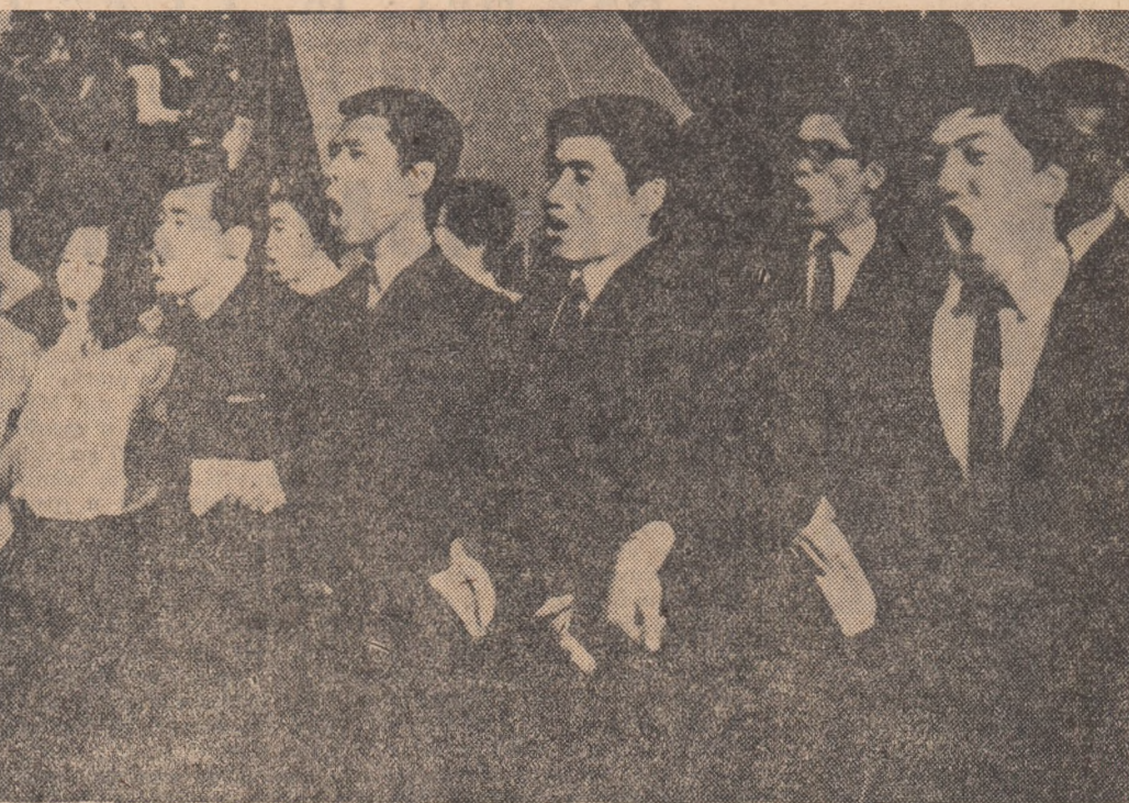
Tineri din Tokio în timpul unei demonstrații împotriva „tratatului de securitate” japono-american.