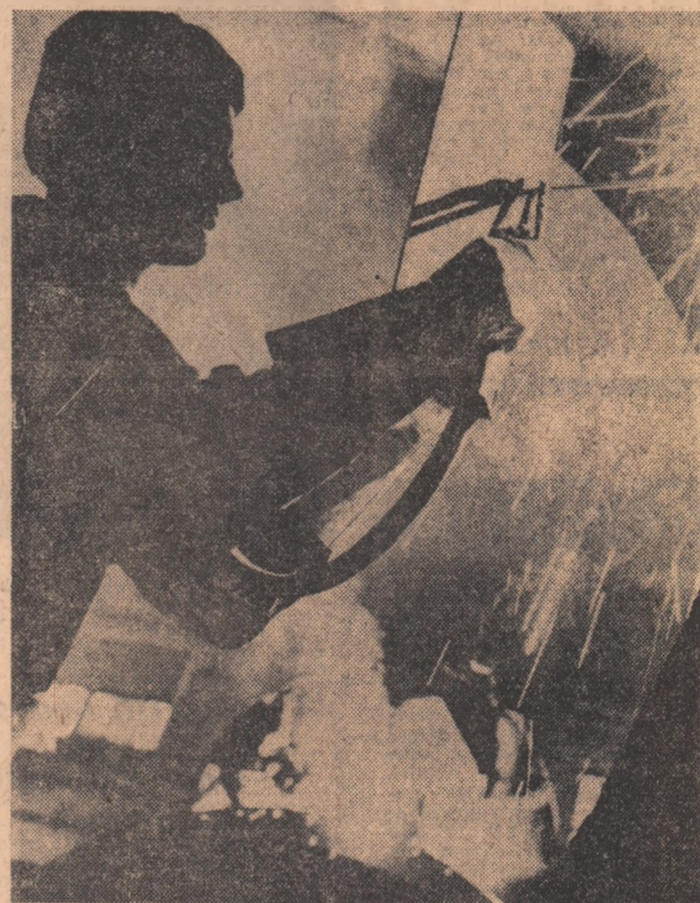
In secția cazangeriei grea de la Uzinele „Vulcan” din București