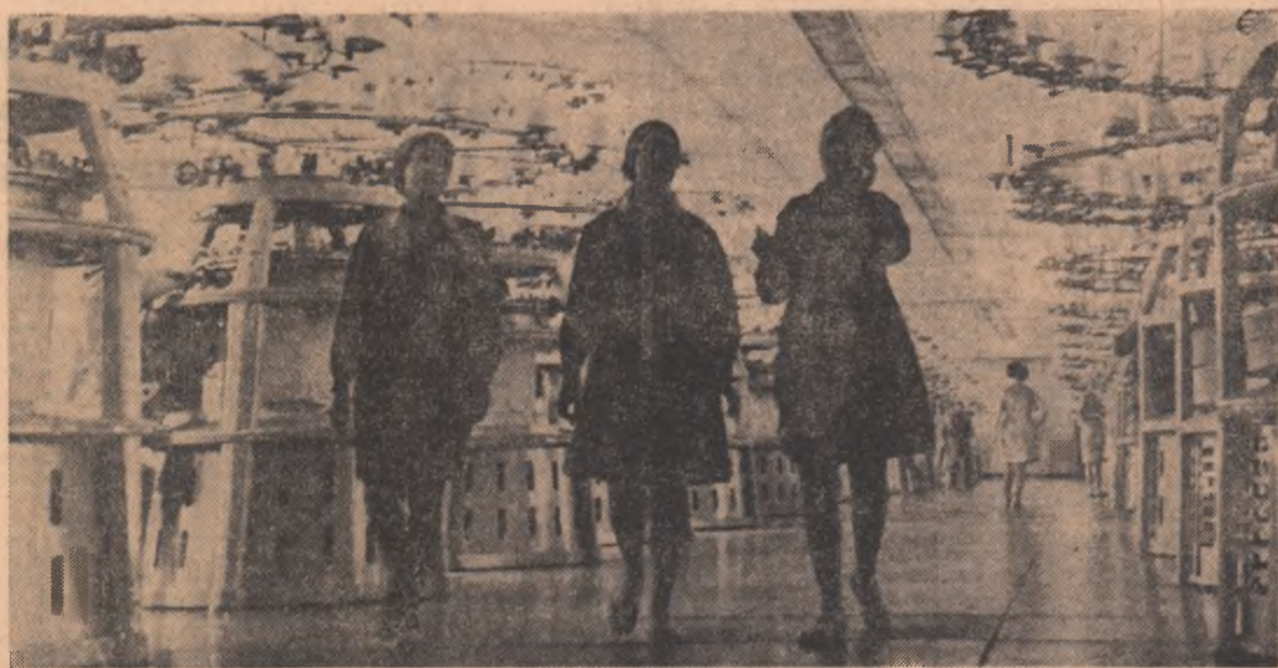
In acest instantaneu, foloreporteurul nostru a surprins pe primele trei muncitoare din schimbul care urmează să intre în producție peste câteva minute, la Fabrica de tricotate „Moldova” din Iași