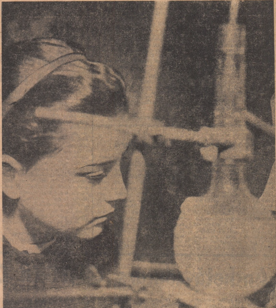
Problema de chimie

ANUL XXVI, SERIA II, NR. 6400 4 PAGINI — 30 BANI VINERI 12 DECEMBRIE 1969