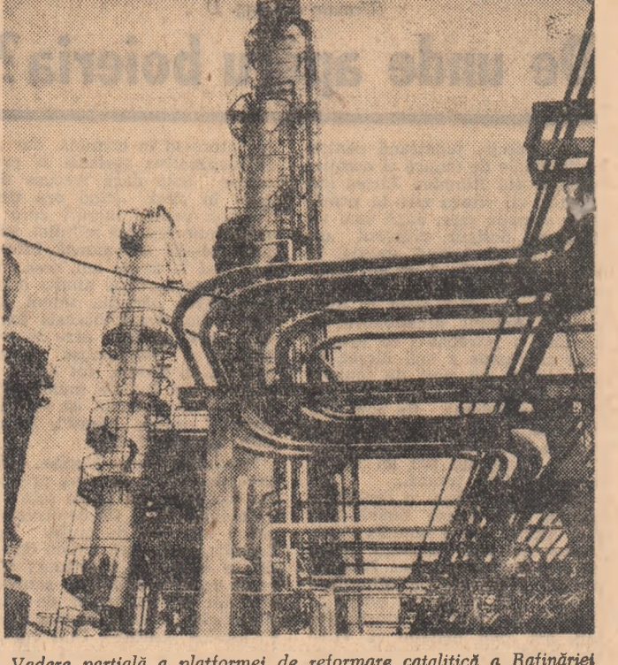
Vedere parțială a platformei de reformare catalitică a Rafinării Pitești.