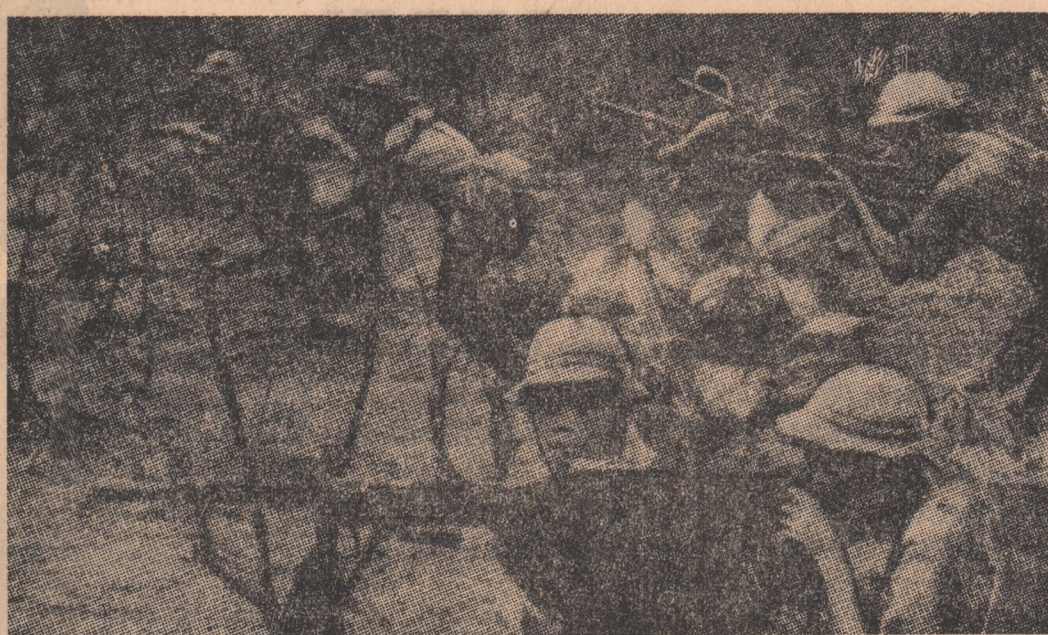
Vienamul de sud. O subunitate de patrioți acționând în zona Platourilor Inalte.