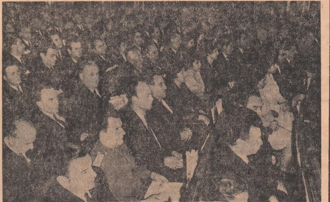
În timpul lucrărilor Marii Adunări Naționale.