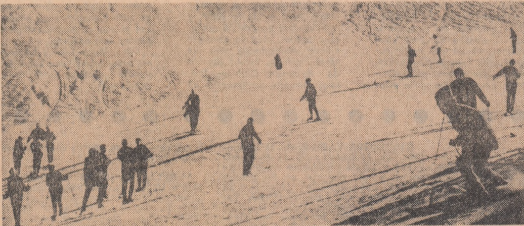
Pe pîrtia de schi de la Postăvoaru.