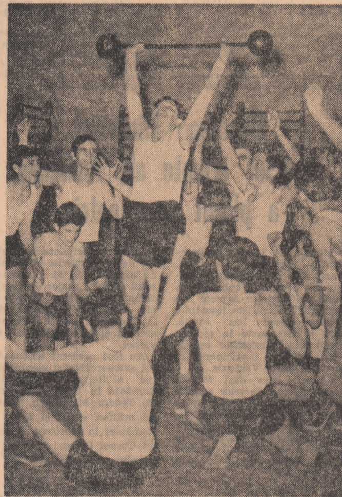
„Bravo!” — par a spune vocile din jur, cu bucurie și emoția pe care le provoacă doborârea unui... record.

Odată cu zăpada, sporturile „albe” își invită participanții. Iarna însăși, anotimp sosit întotdeauna cu o doză de inedit, „aduce” stimulentele necesare. Depinde de modul cum sînt... recepționate. Organizația U.T.C. a creat, în acest sens, o tradiție menită să alibă o audiență amplă în masa tineretului. În general, constatăm diversitatea ramurilor sportive și în mediul sătesc, ediția de iarnă a „Cupei tineretului de la sate”, înfîșurîndu-se în această arde. Cum ne aflăm din nou în „miezul problemei”, am efectuat o anchetă la care au răspuns, de astă dată, 44 de președinți ai asociațiilor sportive sîtești din județul Mureș.