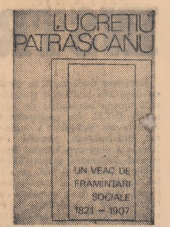
UN VEAC DE FRĂMÎNTĂRI SOCIALE 1821 — 1907