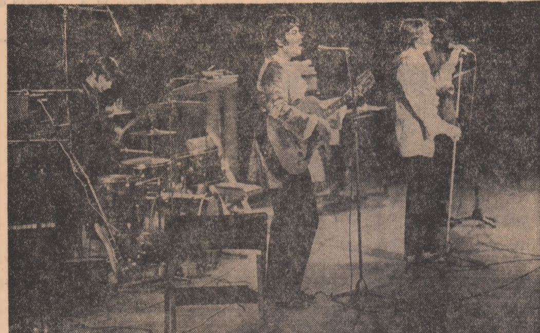
Formația timișoreană „Phoenix” (premiul pentru originalitate) în timpul spectacolului de gală.

cu numai că nu poate abdica, dar nu trebuie să mai facă nici o concesie.