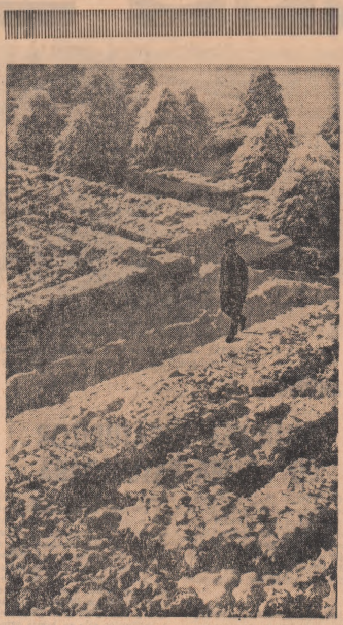
Iarna, pe aleile Palatului Mogoșoaia.