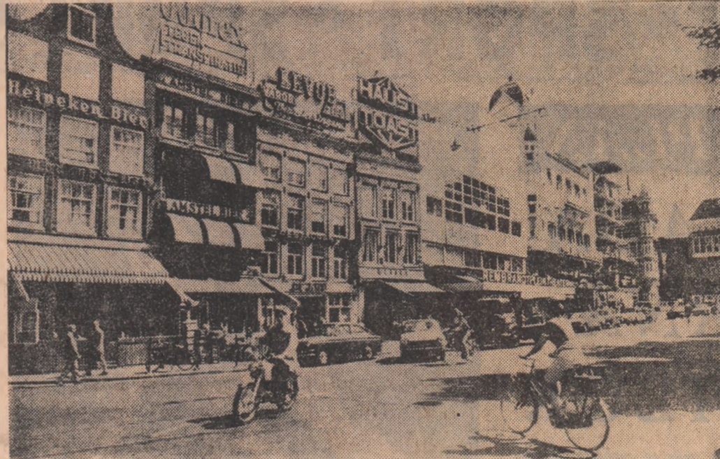
In centrul Amsterdamului

● O UNITATE a forțelor patriotice sud-vietnameze a atacat în cursul duminicii de duminică o tabără americană situată la numai 40 km de Saigon, a anunțat un purtător de cuvînt al comandamentului trupelor S.U.A. Agenția Reuter informează că membrii detașamentului FNE au atacat obiectivul american cu un puternic foc de mitralieră. Potrivit primelor date, 12 militari americani au fost omorâți sau răniți.