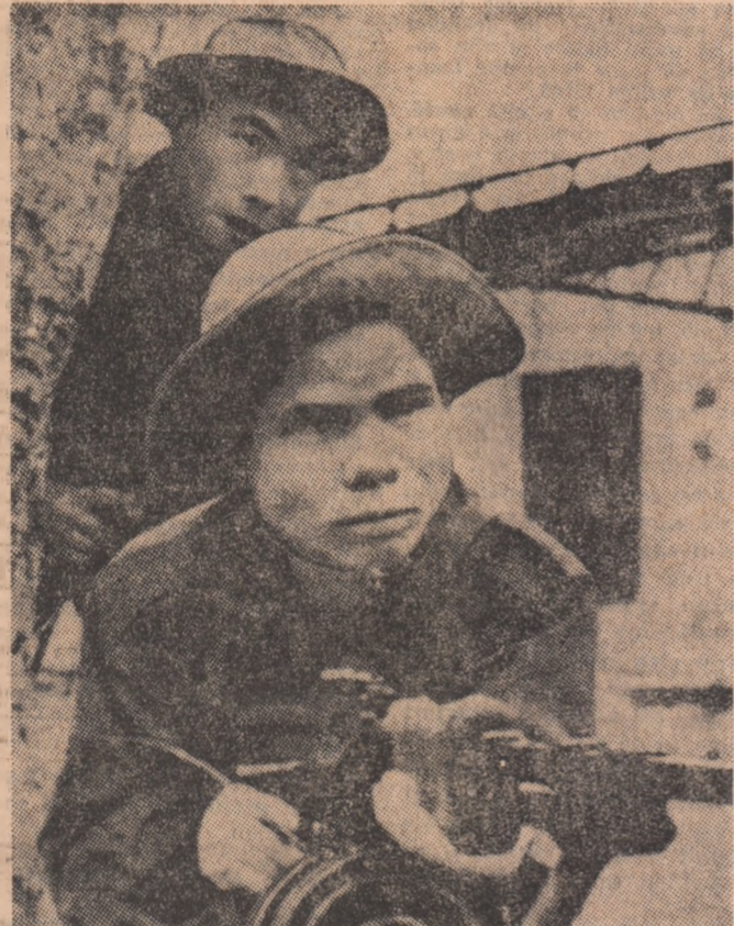
Ngo Tuong Kien și Pham Van Song sunt doi eroi ai forțelor patriotice sud-vietnameze

O bombă ascunsă într-un automobil a explodat în noaptea de sâmbătă spre duminică în apropierea sediului poliției din Dublin. Atentatul nu a făcut victime dar automobilul, care fusese furat, a fost distrus. Acesta este al cincilea atentat care are loc în Irlanda de nord în ultimele luni. Ultimul dintre ele s-a produs vineri la Dublin unde o încălțătură explozivă a avarat monumentul eroului luptei pentru independența irlandeză, Daniel O'Connell. Acest atentat, ca și cele precedente, a fost revendicat de organizația extremistă stăpânită din Irlanda de nord, „Forța voluntarilor din Ulster”.