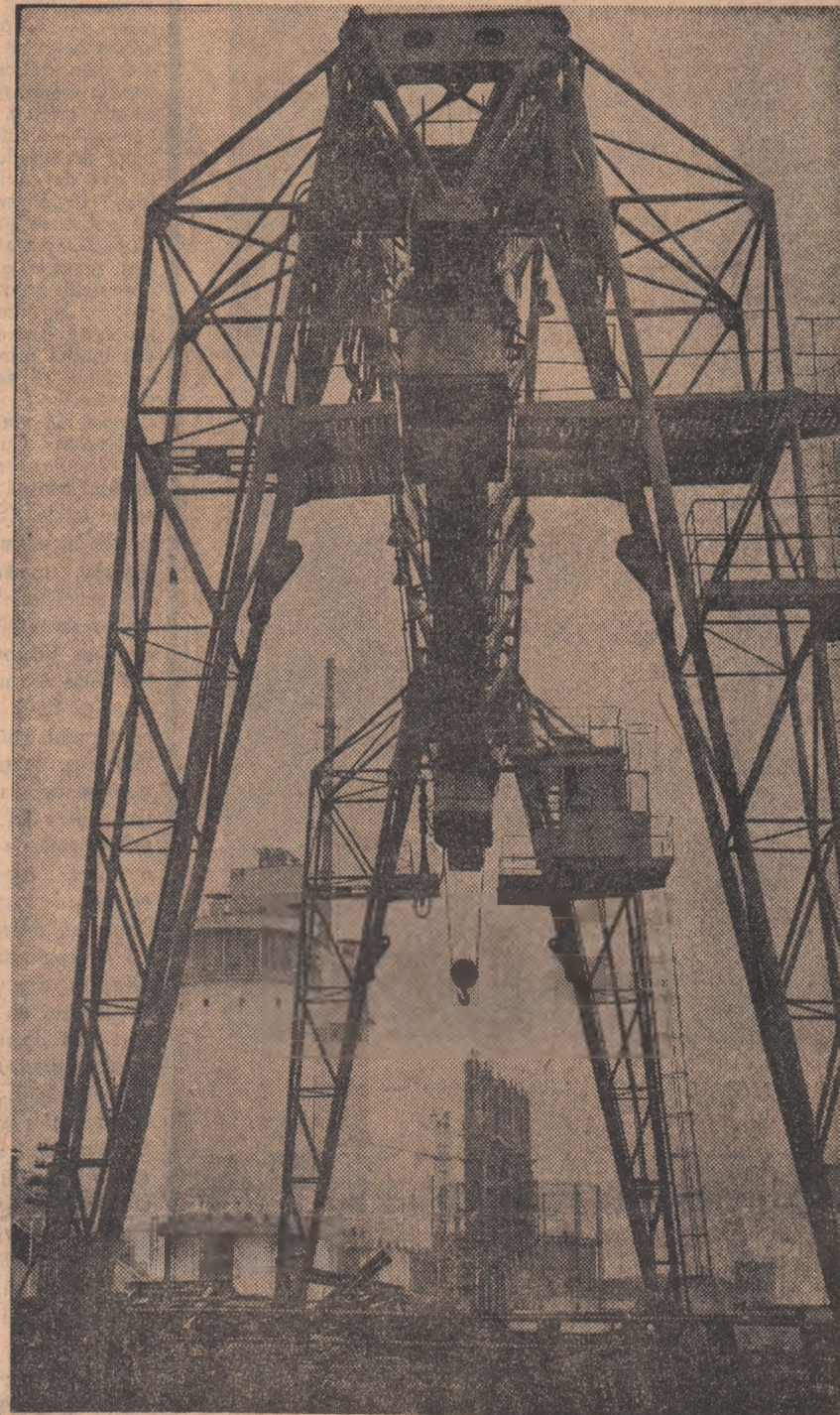
Dimensiuni moderne în peisajul industrial al Craiovei: Combinatul chimic de la Ișalnița.