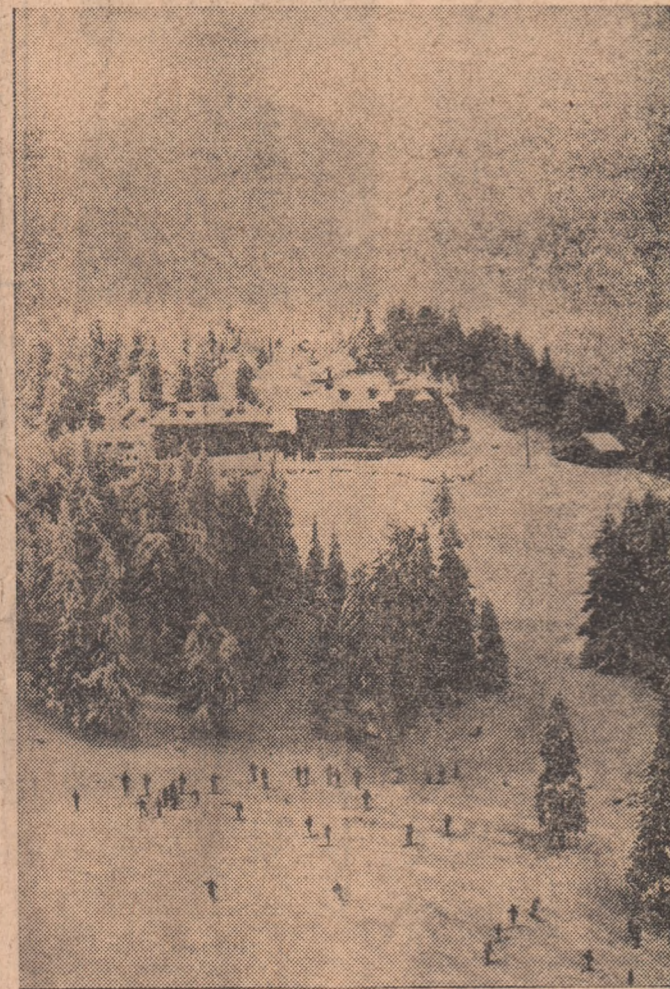
Pe Postăvoar, în apropierea cabanei Cristianul Mare