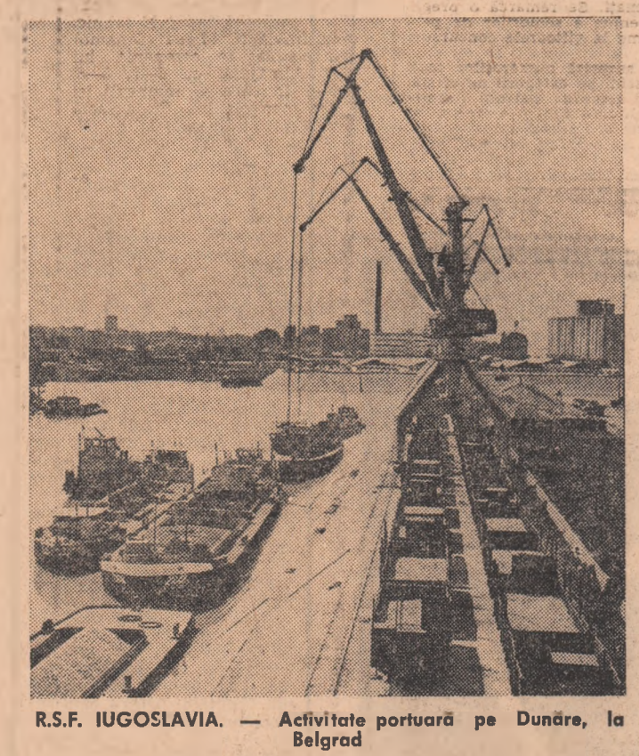
R.S.F. IUGOSLAVIA. — Activitate portuară pe Dundre, la Belgrad

În acest început de an, America nu este preocupată doar de „Zodiac”. Bătăliile în localitatea R.S.F. IUGOSLAVIA, — Activitate portuară pe Dundre, la Belgrad