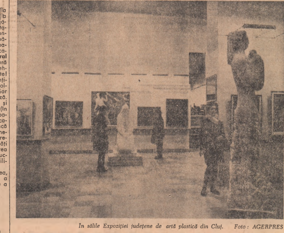
În sălile Expoziției județene de artă plastică din Cluj.

face față tehnicii noi, și alta este ridicarea celor mai înzestrați, spre vîrfurile, din ce în ce mai înalți, al calificărilor științifice maxime. Confuzia se face — vai! — adeseori, prin vorbe mari, ca acestea: „azi, porțile învățămîntului superior sînt deschise pentru toți!”. Da, pentru toți, din punct de vedere social — orînduirea noastră desființează obstacolul material al studiilor superioare, — dar nu pentru toți, indiferent de înzestrare, aptitudini, talent. Nevoia de a avea cît mai multe cunoștințe nu trebuie înțeleasă ca o gonă în grup, spre vîrfuri, ci tocmai prin exigența sporită față de cei cu calificare medie! Or, ce se întîmplă, practic? În școală, profesorul îl va stimula (fiisec!) pe cel bine înzestrat prezicîndu-i „un mare viitor”, iar pe celălalt îl va „admonesta” (și din păcate îl și admonestează) astfel: „nu ești bun de nimic, du-te la meserie”! (cuvînte pe care de multe ori copiii le aud și din gura părinților). Exact metoda prin care se ajunge la deprecieră, la ignorarea valorii unei profesii calificante, demne de toată stima și de toată exigența!... Iar dacă psihologul va „ratifica” această optică îngustă, confuzia nu va face decît să crească, în ciuda unui succes înregistrat în acest an (dar în alți ani?...), la cîteva școli din Cluj.