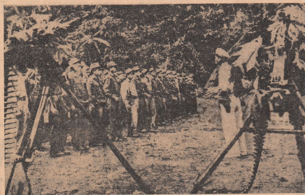
LAOS. — Unitate a forțelor patriotice înainte de a pleca în misiune

CHERBOURG. — Agenția France Presse anunță că sâmbătă seara a părăsit portul Cherbourg, îndreptându-se spre portul irakian Bassorah din Golful Persic, vasul irakian „Ramadan XIV”, având la bord o încărcătură de 200 tone de armament francez.