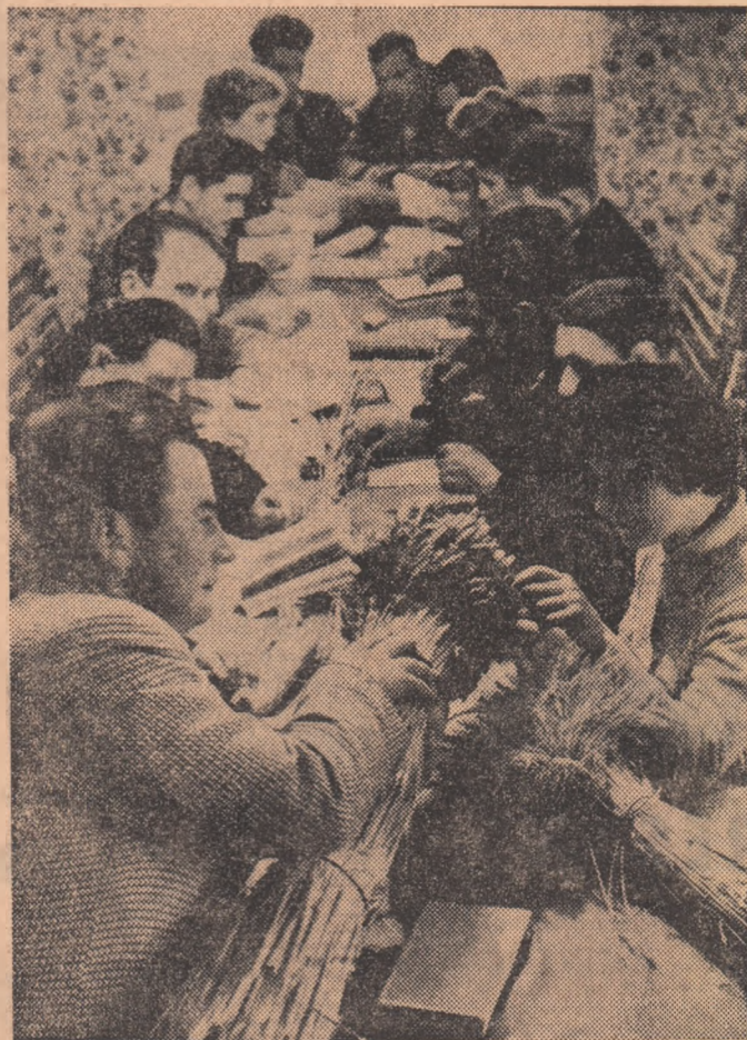
În aceste zile la șantier, pe tot cuprinsul țării se desfășoară învățămîntul agrozotehnic. În fotografie un aspect de lucru.